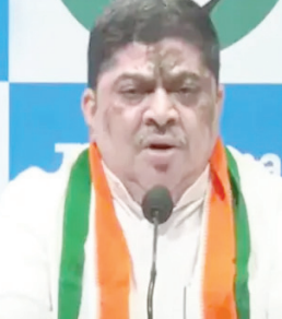
మి భాగస్వామ్య పక్షాలైన బీజేపీ నాయకులొకవైపు, జనసేన అధినేతతో పాటు మరోవైపు డి.బి.సి నాయకులు చేస్తున్న వ్యాఖ్యలు సముచితంగా లేవన్నారు. రాష్ట్ర విభజన ఏదో అనుచితంగా జరిగినట్లు, అసంబంధంగా తెలంగాణ ఏర్పడినట్లు చేస్తున్న అసంబంధ దర్పణ వ్యాఖ్యలు తెలుగువారి మధ్య అనవసరమైన స్పర్ధలు, చైష్షమ్యాలు, ద్వేషాలు రగిలించేవిగా ఉంటున్నాయన్నారు. మిగతా 2లో..

తెలుగువారి మధ్య స్పర్ధలు రగిలించనీయొద్దు ఏపీ సీఎం చంద్రబాబుకు మంత్రి పాన్నం బహిరంగ లేఖ హైదరాబాద్, ఏప్రిల్ 21 (వృధయం ప్రతినీతి): రాష్ట్ర విభజనపై వివాదాస్పద, అనుచిత వ్యాఖ్యలు చేయకుండా కూటమి నేతలను అడ్డుకోవాలని రాష్ట్ర రవాణా శాఖ మంత్రి పాన్నం ప్రభాకర్, ఏపీ సీఎం చంద్రబాబు నాయుడుకు కోరారు. తెలంగాణ ఏర్పాటుపై అనవసర ద్వేషాలు రగిల్చడం ఎవరికీ మంచిది కాదని ఇది మీకు తెలియదీ కాదన్నారు. ఏపీలో మి భాగస్వామ్య పక్షాలైన బీజేపీ నాయకులొకవైపు, జనసేన అధినేతతో పాటు మరోవైపు డి.బి.సి నాయకులు చేస్తున్న వ్యాఖ్యలు సముచితంగా లేవన్నారు. రాష్ట్ర విభజన ఏదో అనుచితంగా జరిగినట్లు, అసంబంధంగా తెలంగాణ ఏర్పడినట్లు చేస్తున్న అసంబంధ దర్పణ వ్యాఖ్యలు తెలుగువారి మధ్య అనవసరమైన స్పర్ధలు, చైష్షమ్యాలు, ద్వేషాలు రగిలించేవిగా ఉంటున్నాయన్నారు. మిగతా 2లో..