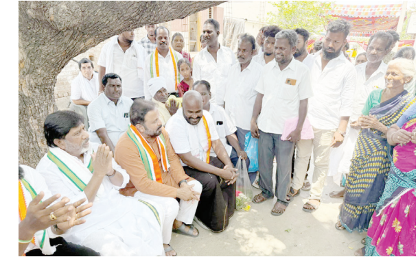
యూనిట్ బలమైన పునాదులు వేసారని ఆయన పేర్కొన్నారు. లోకీకవాదాన్ని కాపాడటంలో తమిళ ప్రజలు ఎప్పుడూ ముందుంటారని ఆయన ప్రశంసించారు. ఢిల్లీ పీఠంపై ఉన్న పాలకులు తమిళ సంస్కృతిని, భాషను, హక్కులను అణచి వేయాలని చూస్తున్నారని భట్టి విమర్శించారు. ఇలాంటి కక్షలను ఎదుర్కోవాలంటే సెక్యూలర్ కక్షల బలవంత అనివార్యమని, అందుకే స్టాలిన్ నాయకత్వాన్ని బలపరచాలని ఆయన పిలుపునిచ్చారు. విభజన రాజకీయాలకు వ్యతిరేకంగా ఓటు రాహుల్ గాంధీ అందిస్తున్న ప్రేమ సందేశం, స్టాలిన్ మిగతా 2లో.. చేపట్టిన

ఆత్మగౌరవానికి తమిళ ప్రజల మద్దతు తెలంగాణలో హామీలన్నీ అమలు చేశాం : డిప్యూటీ సీఎం భట్టి విక్రమారావు తమిళనాడు : తమిళనాడులో డిఎంకె - కాంగ్రెస్ కూటమి అధికారం లోకి రావడం భార్యమని డిప్యూటీ సీఎం భట్టి విక్రమారావు దీనిని ప్రశంసించారు. తమిళనాడు శాసనసభ ఎన్నికల ప్రచారంలో భాగంగా విజయవంతంగా ప్రచారం చేశాం. మూడో ఎంపీ మద్దతు యాక్టివ్ డిప్యూటీ సీఎం భట్టి విక్రమారావు కలిసి రాజీవ్ జిల్లా పోలింగ్ నియోజకవర్గంలోని కారిక్కల్, వీరనట్టూర్, అరియూర్, అయిపేడు ప్రాంతాల్లో మంగళవారం విస్తృతంగా పర్యటించారు. కూటమి అభ్యర్థుల తరఫున ప్రచారం నిర్వహించారు. ఈ సందర్భంగా భట్టి మాట్లాడుతూ.. తమిళ ప్రజలు అభివృద్ధి, లోకీకవాదానికే ప్రజల పట్టం కడతారని చెప్పారు. అత్యగౌరవానికి తమిళ ప్రజల మద్దతు చెబుతారని ఆకాంక్షించారు. ఎం.కె. స్టాలిన్ నాయకత్వంలోని ప్రభుత్వం భారీ మెజారిటీతో తిరిగి అధికారాన్ని తెచ్చుకుంటే చేసుకోబోతున్న భట్టి విక్రమారావు చెప్పారు. మహాత్మ్య పథకంలో మహిళలకు ఉచిత బస్సు ప్రయాణం, గృహ జ్యోతిలో భాగంగా 200 యోగిస్తూ కచ్చితత్వంతో సర్వే పూర్తి చేయిస్తున్నామని తెలిపారు.