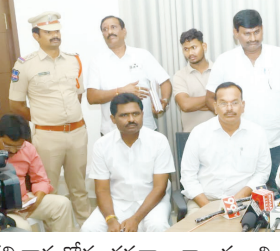
దని రాష్ట్ర రోడ్డు భవనాల శాఖ మంత్రి కోమటిరెడ్డి వెంకటరెడ్డి వెల్లడించారు. పదేళ్లలో అప్పలు చేసిన వెళ్లి ఒకేసారి బంగారు తెలంగాణ చేస్తామని కాంగ్రెస్ ఎప్పుడూ చెప్పలే

గత పాలనలో ధాన్యం నిల్వల విషయంలో రూ.1.11 వేల కోట్ల అవినీతి జరిగింది : రాష్ట్ర మంత్రి కోమటిరెడ్డి వెంకటరెడ్డి శ్రీశైలం, ఏప్రిల్ 21 (వృధయం ప్రతినీతి): రాష్ట్రాన్ని ఒకేసారి బంగారు తెలంగాణ చేస్తామని కాంగ్రెస్ ఎప్పుడూ చెప్పలే