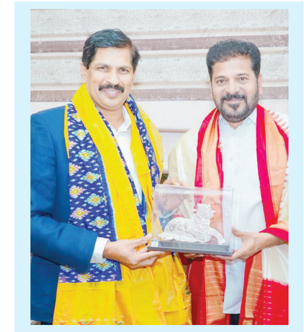
సీఎం రేవంత్ రెడ్డి గారిని జుబ్బి హిల్స్ నివాసంలో మర్యాదపూర్వకంగా కలిసిన తెలంగాణ ఆంధ్రప్రదేశ్ ఇన్ కమ్ ట్యూక్స్ డిప్యూటీ సీఎం భట్టి విక్రమారావు. ఇతర ఉన్నతాధికారులు.