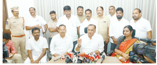
దని రాష్ట్ర లోడ్లు భవనాల శాఖ మంత్రి కోమటిరెడ్డి వెంకటరెడ్డి వెల్లడించారు. పదేళ్లలో అప్పలు చేసి వెళ్లి ఒకేసారి బంగారు చేయాలనే సాధ్యమేనా అని ప్రశ్నించారు. మంగళవారం నల్గొండ జిల్లా కేంద్రంలో ఆయన మీడియాతో మాట్లాడారు. గత ప్రభుత్వం హయాంలో పదేళ్లలో ఒక్క మిగతా 2లో..

గత పాలనలో ధాన్యం నిల్వల విషయంలో రూ. 11 వేల కోట్ల అవినీతి జరిగింది : రాష్ట్ర మంత్రి కోమటిరెడ్డి వెంకటరెడ్డి నల్గొండ, ఏప్రిల్ 21 (పురయం ప్రతినది): రాష్ట్రాన్ని ఒకేసారి బంగారు తెలంగాణ చేస్తామని కాంగ్రెస్ ఎప్పుడూ చెప్పలే