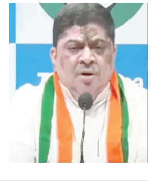
మి భాగస్వామ్య పక్షాలైన బీజేపీ నాయకులతో కలెక్షన్లు, జనసేన అధినేతతో పాటు మరోవైపు టీడీపీ నాయకులు చేస్తున్న వ్యాఖ్యలు సముచితంగా లేవనూరు. రాష్ట్ర విభజన ఏదో అనుచితంగా జరిగినట్లు, అసమంజసంగా తెలంగాణ ఏర్పడినట్లు చేస్తున్న అసందర్భ వ్యాఖ్యలు తెలుగువారి మధ్య అనవసరమైన స్పర్ధలు, వైషమ్యాలు, ద్వేషాలు రగిలించడానికి సింగరేణి నాయకులు మిగతా 2లో..

తెలుగువారి మధ్య స్పర్ధలు రగిలించనీయొద్దు ఏపీ సీఎం చంద్రబాబుకు మంత్రి పాన్నం బహిరంగ లేఖ హైదరాబాద్, ఏప్రిల్ 21 (పురయం ప్రతినది): రాష్ట్ర విభజనపై వివాదాస్పద, అనవసర వ్యాఖ్యలు చేయకుండా కూటమి నేతలను అడ్డుకోవాలని రాష్ట్ర రవాణా శాఖ మంత్రి పాన్నం ప్రభాకర్, ఏపీ సీఎం చంద్రబాబు నాయుడును కోరారు. తెలంగాణ ఏర్పాటుపై అనవసర ద్వేషాలు రగిల్చడం ఎవరికీ మంచి కాదని ఇది మీకు తెలియంది కారన్నారు. ఏపీలో మిగతా 2లో..