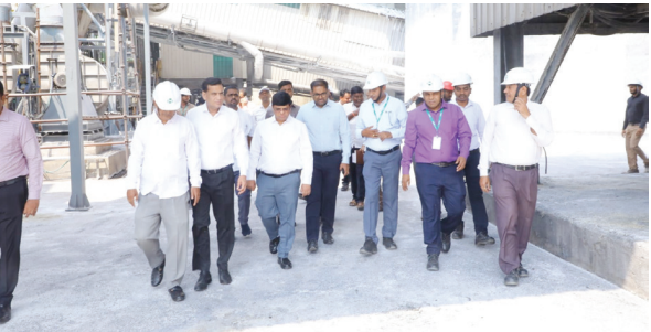
ఆర్ఎఫ్సీఎల్ ఫైబర్ ఫ్యూరి సామర్థ్యంతో పనిచేయడానికి ప్రభుత్వం సహకారం రామగుండంలో యూరియా ఉత్పత్తి, సరఫరాపై సమీక్ష - ఫిల్డ్ స్టాయిలో పరిశీలన