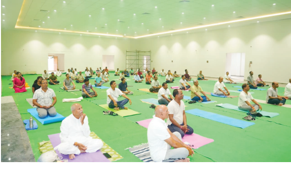
విద్యానానికి యోగ కీలకమని, ప్రతి ఒక్కరూ దీనిని రోజూ జీవితంలో భాగం చేసుకోవాలని అవసరం ఉందని అన్నారు. యోగ శిబిరాన్ని సద్దినయోగం చేసుకోవాలని కోరారు.