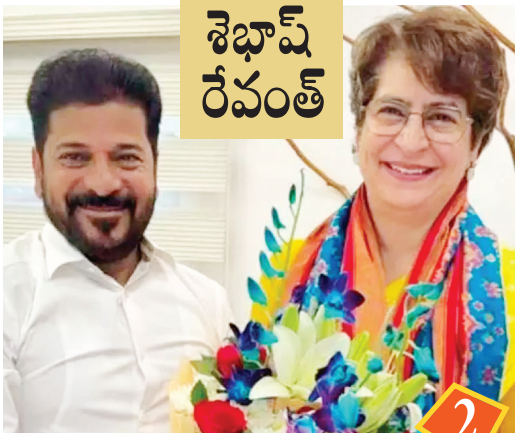
డిలమిటేషన్ పై ప్రత్యామ్నాయ సూచనలు చేసినందుకు సిఎం రేవంత్ రెడ్డిని అభినందించిన ప్రియాంకా గాంధీ

మహిళా బిల్లుకు కాంగ్రెస్ వ్యతిరేకం కాదు మూడు బిల్లుల పేరుతో డిలమిటేషన్ ను రుద్దదానికి బిజెపి కుట్ర చేసింది దాని వద్ద అధికారం ఉన్నప్పటికీ ఆర్థిక వనరులు మాత్రం రాష్ట్రాల నుంచే అందుతున్నాయి న్యూఢిల్లీలో మీడియాతో సిఎం రేవంత్ రెడ్డి