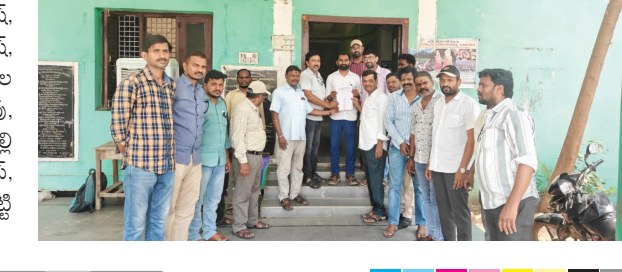
తపస్విల్లూర్ కార్యాలయంలో డిప్యూటీ తపస్విల్లూర్

ధర్మపురి, (పుడయం ప్రతినిధి): తెలంగాణ ప్రభుత్వం జూన్ 2వ తేదీ లోపు సూచన పేర్కొని ప్రకటించాలని, అలాగే సీపీఎస్ విధానాన్ని రద్దు చేసి పాత పెన్షన్ విధానాన్ని అమలు చేయాలని తపస్ దివేంద్రులు చేసింది. శుక్రవారం తపస్విల్లూర్ కార్యాలయంలో డిప్యూటీ తపస్విల్లూర్