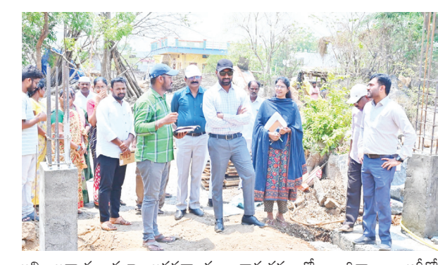
అసిఫాబాద్ ప్రజా అవసరాలకు అనుగుణంగా నిర్మాణంలో ఉన్న అభివృద్ధి పనుల సకాలంలో పూర్తి చేసి ప్రజలకు అందుబాటులోకి తీసుకురావాలని సంబంధిత అధికారులను అడిగించారు ఈ

జగిత్యాల (పుడయం ప్రతినిధి) ప్రజాపాలన ప్రగతి ప్రజాశక్తి 99 రోజుల కార్యక్రమం ప్రజాశక్తి కార్యక్రమంలో భాగంగా జిల్లా కలెక్టర్ మండలం యశ్వంతరావుపేట గ్రామాన్ని శుక్రవారం సందర్శించి నిర్మాణంలో ఉన్న అభివృద్ధి పనులను పరిశీలించారు. గ్రామంలోని ఇందిరమ్మ ఇండ్ల నిర్మాణ పనుల పురోగతిని సమీక్షించారు అంగన్వాడీ భవనాల నిర్మాణ స్థితిని పరిశీలించి తగు సూచనలు అందించారు పనుల నాణ్యతపై ప్రత్యేక దృష్టి పెట్టాలని అధికారులను అడిగించారు. పెండింగ్లో ఉన్న పనులను వెంటనే పూర్తి చేసేలా తగు చర్యలు తీసుకోవాలని సూచించారు నాణ్యత ప్రమాణాలు పాటించడం తప్పనిసరి