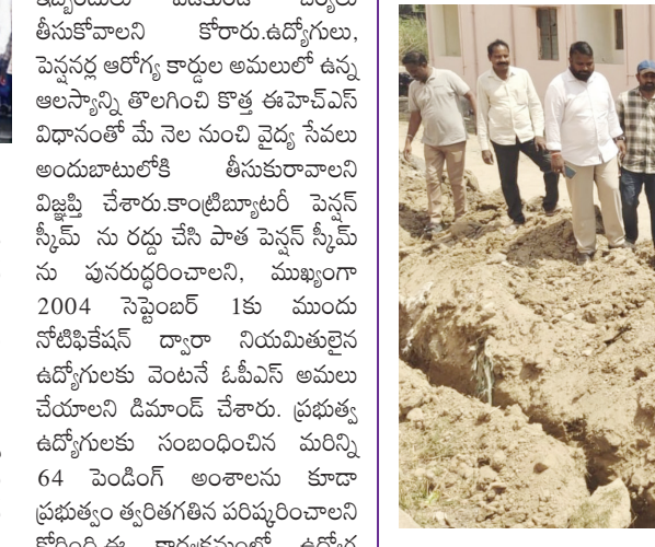
ఉబుల్ బెడ్రూం ఇండ్లలో సదుపాయాలు కల్పిస్తాం.