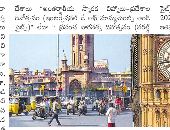
హెరిటేజ్ డే" పాటింపుట 1983 నుంచి కొనసాగుతున్నది. వారసత్వ కట్టడాలు, ఇతర ప్రజాదరణ పొందిన కట్టడాలు తరతరాలుగా మానవాళి విజ్ఞానాన్ని, విశ్వాన్ని, మానసిక ప్రశాంతతను, పర్యాటకాన్ని అందిస్తున్న ఉన్నాయి. వీటిని అపురూపంగా కాపాడుకోవడం, వాటి పరిరక్షణకు అవసరమైన చర్యలను సత్వరమే తీసుకోవడం, మన సాంస్కృతిక వైభవ చిహ్నాలను సంరక్షించుకోవడం, వాటిని జాతీయ గుర్తింపు కలిగిన కట్టడాలుగా నిలబెట్టడం మన కీలక కర్తవ్యమని గమనించాలి.

అంతర్జాతీయ మానవాళిని ఆకర్షిస్తున్న సహజ నిర్మలైన లేదా మానవ నిర్మిత కట్టడాలు లేదా ప్రదేశాలను "వారసత్వ కట్టడాలు (హెరిటేజ్ స్ట్రక్చర్స్)" లేదా "సార్వక విహ్వలు (మాన్యుమెంట్స్)" లేదా "ప్రదేశాలు (సైట్స్)" అని పిలుస్తారు. అత్యంత పురాతన దేవాలయాల నుంచి అత్యధుత కట్టడాల వరకు అన్ని ప్రదేశాలు అసాదిగా మానవ నాగరికత చిహ్నాలుగా, గత వారసత్వ సంపద పునాదులుగా కొనసాగుతూనే ఉన్నాయి. వారసత్వ కట్టడాలు, ప్రదేశాలు మానవ సహజ మానసిక ఆలోచన ప్రదానాలుగా, మానవాళి గత చరిత్రకు సాక్షులుగా గుర్తింపగా నిలబడి ఉన్నాయి. మన పునాదులను పటిష్ట పరుచుకోవడం, వాటి భద్రతకు నడుం బిగించడం నేటి ఆలోచనాపరమైన మానవాళి కర్తవ్యం. మనం నివసిస్తున్న ప్రదేశానికి ఏదో ఒక ప్రత్యేకత ఉంటుంది. వాటిలో పురాతన కట్టడాలు, గత వైభవం కలిగిన దేవాలయాలు, అద్భుత సహజ ప్రకృతి ప్రదేశాలు, మనం సగర్వంగా చెప్పుకునే వారసత్వ కట్టడాలు ఉంటాయి.