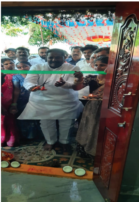
చెన్నారావుపేట ఏప్రిల్ 12 (వృద్ధయం న్యూస్ ప్రతినీతి):

చెన్నారావుపేట మండల కేంద్రంలోని స్ట్రోక్ గ్రామం లో నిగూడు లేని లకు నీడ కల్పించాలనే ఉద్దేశ్యంతో