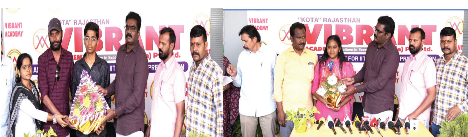
హనుమకొండ టౌన్, ఏప్రిల్ 12 (వృద్ధయం ప్రతినీతి):

వారం విడుదలైన ఇంటర్మీడియట్ క్రాఫ్ట్ హనుమకొండ నక్కలుగుట్టలో టైంట్ జూనియర్ కళాశాల విద్యార్థుల యొక్క ప్రతిభ కనబరిచి ప్రభంజనం సాధించారు. స్టేట్ టాప్ మార్కులతో కాకుండా కేంద్రీయ దశలోనూ చాలారు. కల వివరాలు: 5వీ సంవత్సరం (MPC): ఫరం రిజిస్ట్రేషన్: 468/470 5వీ మెన్షల్: 468/470 5వీ ఫోటో: 468/470 8 వంద విద్యార్థులు 460 కంటే ఎక్కువ మార్కులు సాధించి రికార్డు సృష్టించారు.