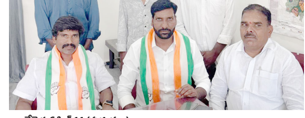
చేవెళ్ల, ఏప్రిల్ 11 (పుడయం):

సానికలకు ప్రాధాన్యత ఇవ్వాలని లేబర్ సెల్ నేతల డిమాండ్