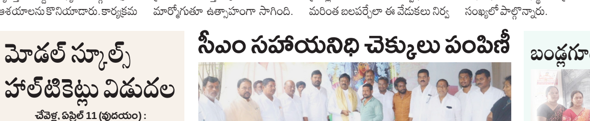
శంకర్ పల్లి, ఏప్రిల్ 11 (పుడయం):