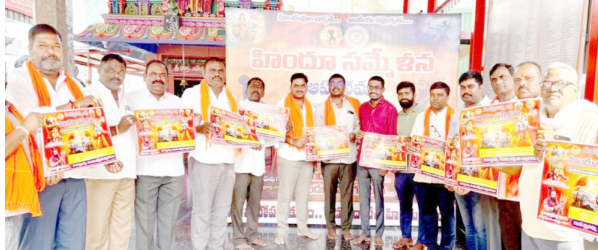
కుత్బులాపూర్, ఏప్రిల్ 11 (పుడయం ప్రతినధి):