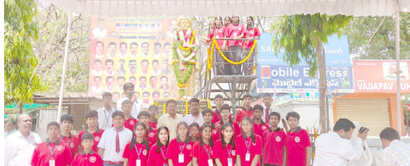
శంకర్ పల్లి, ఏప్రిల్ 11 (పుడయం):

బిల్కేట్ స్టార్స్ హై స్కూల్ ఆధ్వర్యంలో జయంతి వేడుకలు