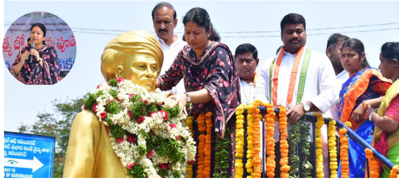
విద్య అందించేందుకు పాఠశాలలు, అనాథల కోసం ఆశ్రమాలు ఏర్పాటు చేసిన మహానీయుడి పేర్కొన్నారు.

సమాజానికి పూలే అసమాన సేవలు అందించారు. చదువుతోనే సమాజంలో గుర్తింపు, గౌరవం సాధ్యమని, చదువును నిర్లక్ష్యం చేయకపోయి యువతకు సూచించారు. ఆ రోజుల్లోనే చదువు గొప్పతనం తెలుసుకొని.. బాలికలకు