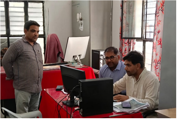
హాస్ నిస్పింగ్ బ్లాక్ జనగణన కార్యక్రమాన్ని