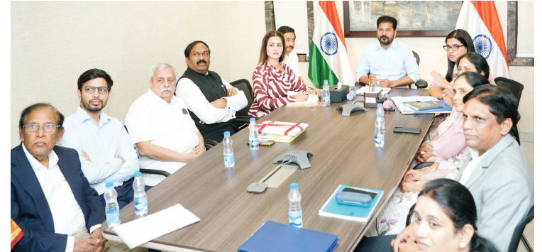
కేటాయింపాలన్నారు. సీఎస్ఆర్ నిధుల వినియోగంలో ఇప్పటి వరకు సరైన విధానం లేనందున

హైదరాబాద్, ఏప్రిల్ 08 (పుడయం ప్రతినిధి) : కంపెనీలు సమాజాభివృద్ధికి చేసే ఖర్చును అవసరం సర ఖర్చుగా కాకుండా సమాజంలో భాగస్వామ్యంగా చూడాలని సీఎం రేవంత్ రెడ్డి సూచించారు. బుద్వారం జూబ్లీహిల్స్ లోని తన నివాసంలో సీఎస్ఆర్ నిధులకు సంబంధించి వివిధ కార్పొరేట్ కంపెనీల ప్రతినిధులతో ఆయన సమావేశమయ్యారు. ఈ సందర్భంగా సీఎం రేవంత్ రెడ్డి మాట్లాడుతూ కంపెనీలు సీఎస్ఆర్ కు చేస్తున్న ఖర్చులకు వంద శాతం సహకారం ప్రాధాన్యం ఇస్తుందని వివరించారు. తమ ప్రభుత్వం విద్యా, వైద్యం, జల వనరుల సంరక్షణకు ప్రాధాన్యం ఇస్తుందని వివరించారు. కంపెనీలు వీటితో పాటు తమకు ఇష్టమైన ఏ రంగాన్నైనా ఎంచుకొని సీఎస్ఆర్ నిధులు విని