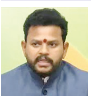
న్యూ ఢిల్లీ : దేశవ్యాప్తంగా ఎయిర్పోర్టుల ఏర్పాటుకు సంబంధించి పన్నోన్న అన్ని దిమాండ్లను పరిశీలిస్తున్నట్లు

• ఆదిలాబాద్ లో పెద్ద ఎయిర్ పోర్టు నిర్మాణం • సైనిక, పౌరుల అవసరాలకు అనుగుణంగా ఏర్పాటు • సివిల్ ఏవియేషన్లో కలిసి పని చేసేందుకు రక్షణ శాఖ అంగీకారం • ఈ నెల 17న ఆదిలాబాద్ భూముల పరిశీలనకు అధికారులు • అంతర్జాతీయ ఎయిర్ పోర్టు ప్రతిపాదనపై ఫీజుబులిటీ నివేదిక సానుకూలం : మీడియాతో కేంద్ర పౌర విమానయాన శాఖ మంత్రి రామ్మోహన్ నాయుడు