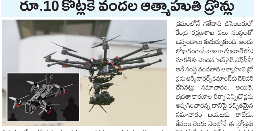
విషయంలో భారత్ మరల అప్రమత్తంగా వ్యవహరిస్తోంది. సాంకేతికతను అందించుకుంటూనే ప్రాణనష్టం తప్పకుండా.. శత్రు మూకల్ని అంతం చేసేందుకు వీలుగా ఆత్యాహుతి డ్రోన్లను సమకూర్చుకుంటోంది. ఈ క్రమంలోనే గతేడాది డిసెంబరులో కేంద్ర రక్షణశాఖ పలు సంస్థలతో ఒప్పందాలు కుదుర్చుకుంది. ఇందులో భాగంగానే తాజాగా గుజరాత్ లోని సూరత్ కు చెందిన 'ఇన్ సైడ్ ఎఫ్ ఏమ్' అనే సంస్థ వందలాది ఆత్యాహుతి డ్రోన్లను అమ్మకం చేసినట్లు సమాచారం. అంతే, భద్రతా కారణాల రీత్యా ఎన్ని డ్రోన్లను అమ్మించారన్న దానిపై కచ్చితమైన సమాచారం బయటకు రాలేదు. కేవలం రెండు నెలల్లోనే ఈ డ్రోన్లను డెలివరీ చేయడం విశేషం. ఆత్యాహుతి కొనుగోలు కింద సైన్యం వీటిని తీసుకున్నట్లు తెలుస్తోంది.

పుణ్యం దెస్సె: భారత్ సైన్యం అమ్ములపాడిలో మరో అరుదైన ఆయుధం చేరింది. ఆధునిక సాంకేతిక యుద్ధాల్లో కీలక పాత్ర పోషించే తాజాగా గుజరాత్ లోని (కాముకాజి) ఆర్మీ చేతికి వచ్చినట్లు తెలుస్తోంది. ఈ రకానికి చెందిన వందలాది డ్రోన్లను సృష్టించే సంస్థ తాజాగా సైన్యానికి అప్పగించినట్లు సమాచారం. ఈ మేరకు రక్షణశాఖ వర్గాలను ఉటంకిస్తూ పలు అంగ్ల మీడియా కథనాలు వెల్లడించాయి. రూ. 10 కోట్ల బడ్జెట్ తో భాగంగా వీటిని అందజేసినట్లు తెలిసింది. గతేడాది ఏప్రిల్ లో జరిగిన పహల్గాం ఘటన నేపథ్యంలో.. సరిహద్దుల రక్షణ మేరకు భారత్ మరల అప్రమత్తంగా వ్యవహరిస్తోంది. సాంకేతికతను అందించుకుంటూనే ప్రాణనష్టం తప్పకుండా.. శత్రు మూకల్ని అంతం చేసేందుకు వీలుగా ఆత్యాహుతి డ్రోన్లను సమకూర్చుకుంటోంది. ఈ క్రమంలోనే గతేడాది డిసెంబరులో కేంద్ర రక్షణశాఖ పలు సంస్థలతో ఒప్పందాలు కుదుర్చుకుంది. ఇందులో భాగంగానే తాజాగా గుజరాత్ లోని సూరత్ కు చెందిన 'ఇన్ సైడ్ ఎఫ్ ఏమ్' అనే సంస్థ వందలాది ఆత్యాహుతి డ్రోన్లను అమ్మకం చేసినట్లు సమాచారం. అంతే, భద్రతా కారణాల రీత్యా ఎన్ని డ్రోన్లను అమ్మించారన్న దానిపై కచ్చితమైన సమాచారం బయటకు రాలేదు. కేవలం రెండు నెలల్లోనే ఈ డ్రోన్లను డెలివరీ చేయడం విశేషం. ఆత్యాహుతి కొనుగోలు కింద సైన్యం వీటిని తీసుకున్నట్లు తెలుస్తోంది. పుణ్యం దెస్సె: కేబ్లె లక్ష్యాలను చేరుస్తాయి. ■ సాధారణ దళాల వెళ్లలేని ప్రాంతాల్లోకి వెళ్లి దాడులు చేయగలవు. జీఎస్ అందుబాటులో లేని ప్రాంతాల్లో సూ ఉపయోగించేలా వీటిని రూపొందించారు. ■ కఠినమైన వాతావరణ పరిస్థితులను తట్టుకోగలవు. మైన్స్ 35 డిగ్రీల ఉష్ణోగ్రతలోనూ ఈ డ్రోన్లు పనిచేయగలవు.