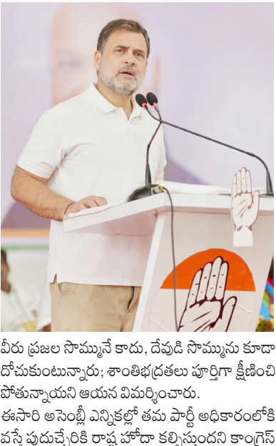
అసెంబ్లీ ఎన్నికల్లో అధికారంలోకి వస్తే పుదుచ్చేరి రాష్ట్ర హోదా కల్పిస్తాం

పుదుచ్చేరి, ఏప్రిల్ 6 (వృద్ధయం): పుదుచ్చేరి ప్రభుత్వం అక్కడి ప్రజల ఆకాంక్షలకు ప్రతిరూపం కాదని, అది వాస్తవానికి ఢిల్లీ పార్లమెంట్ ప్రభుత్వమని కాంగ్రెస్ నాయకుడు రామచంద్రన్ సోమవారం ఆరోపించారు. లాన్సెట్లో జరిగిన ఒక ఎన్నికల సభలో మాట్లాడుతూ, పుదుచ్చేరిలో అధికారంలో ఉన్న ప్రభుత్వం అక్కడి ప్రజల ఆకాంక్షలకు ప్రతిరూపం కాదని, అది ఢిల్లీ పార్లమెంట్ ప్రభుత్వం వలననే సాధ్యమైందని పేర్కొంది. పుదుచ్చేరిలోని ప్రాంతీయ నాయకులను బీజేపీ పక్కన పెట్టి రిమోట్ కంట్రోల్ ద్వారా పాలన సాగిస్తోందని విమర్శించారు. పుదుచ్చేరికి పూర్తి స్వాయత్తాన్ని కావాలని ఆయన అంటున్నట్లు చెప్పింది.