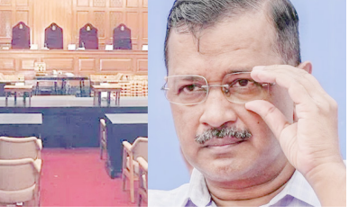
న్యూఢిల్లీ, ఏప్రిల్ 6 (వృద్ధయం):