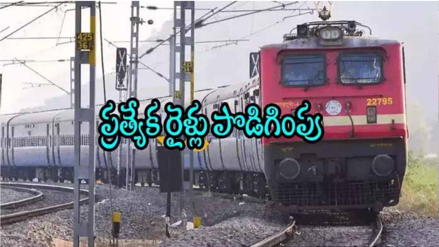
డివిజన్ లోని కేకే లైన్ లో భద్రతాపరమైన ఆధునికీకరణ పనులు జరుగుతున్నాయి. ఈ కారణంగా కొన్ని రైళ్ల గమ్యస్థానాలను కుదించవచ్చు. విశాఖ-కిరందూల్-విశాఖ (58501-58502) రైళ్లు ఈనెల 26, జూన్ 2, 9 తేదీల్లో కొర్రాపుల్ వరకు మాత్రమే నడుస్తాయి.. కిరందూల్ వరకు వెళ్లవు.. కొర్రాపుల్ లోనే ఆగిపోతాయి. భువనేశ్వర్-జగదల్ పూర్ (18447), రూర్కలా-జగదల్ పూర్ (18107) రైళ్లు ఈనెల 25, జూన్ 1, 8 తేదీల్లో కొర్రాపుల్ వరకు నడుస్తాయి. జగదల్ పూర్-భువనేశ్వర్ (18448), జగదల్ పూర్-రూర్కలా (18108) రైళ్లు ఈనెల 26, జూన్ 2, 9 తేదీల్లో కొర్రాపుల్ వరకు మాత్రమే వెళతాయి. ప్రయాణికులు ఈ మార్పులను గమనించాలని రైల్వే అధికారులు సూచించారు.