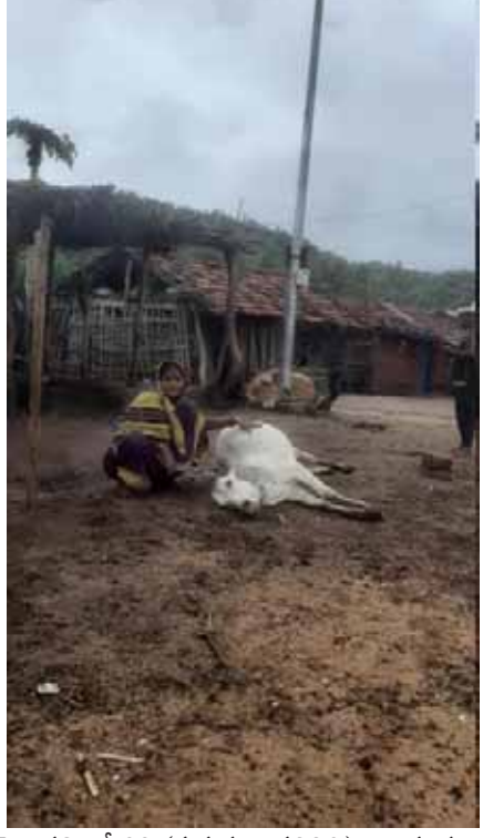
తెల్లపల్లి, మే 23 (పుడయం ప్రతినది) తాండూరు మండలం నర్సాపూర్ గ్రామ పంచాయతీ బెజ్జల (తలండ్ గూడ) లో శుక్రవారం ఉదయం గ్రామంలోని హైమాన్ స్ట్రీట్ స్థంభం వద్ద విద్యుత్ షాక్ తో టేకం సోంబాయి చెందిన ఎద్దు, తలండ్ జంగుబాయి కి చెందిన లేగా కోడే మృతి చెందినట్లు బాధితులు తెలిపారు. విడివిలువ ఎద్దు రూ 40,000, కోడే రూ 10,000 లు ఉంటుందని వారు తెలిపారు. పశువులు మృత్యుచెందటంతో తమ కుటుంబ జీవనాధారం కోల్పోయారు. ప్రభుత్వం సప్లవహారం చెల్లించి ఆదుకోవాలని వారు కోరారు.