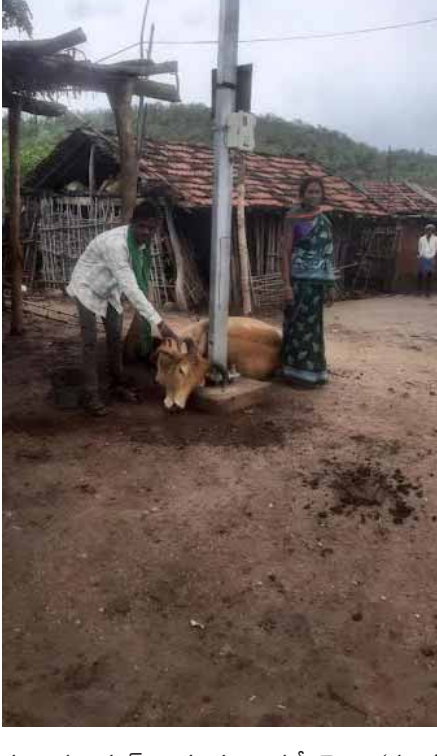
విద్యుత్ షాక్ తో పశువులు మృతి