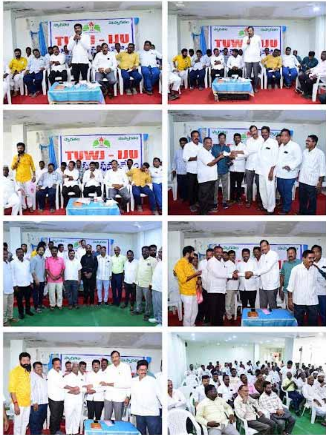
మాట్లాడుతూ సమస్యల పరిష్కారం కోసం జిల్లాలోని జర్నలిస్టులందరూ ఏకతాటిపైకి రావాల్సిన అవసరం ఉన్నదన్నారు. మండల స్థాయి సుంచి టీయూడబ్ల్యుజే బలోపేతం చేసి టీయూడబ్ల్యుజే పట్ల జర్నలిస్టుల విశ్వాసం పెంపొందించేందుకు కృషి చేస్తామన్నారు. సీనియర్ జర్నలిస్టులు పలు విజయ