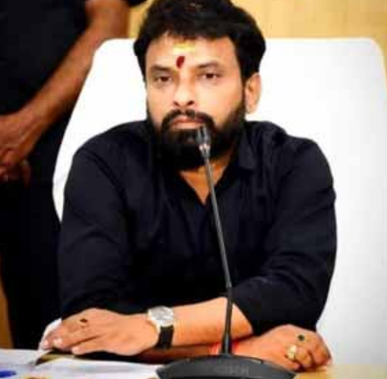
ప్రణాళికలు రూపొందించి అమలుకు సన్నద్ధం అయ్యారు. సూక్ష్మ, చిన్న, మధ్య తరహా పరిశ్రమలు ద్వారా నిరుద్యోగుల జీవితాల్లో వెలుగులు నింపాలనే సదుద్దేశంతో ఈనెల 22 న ఉదయం 9 గంటలకు రామచంద్రపురం లోని వి ఎస్ ఎం ఇంజనీరింగ్ కళాశాల ప్రాంగణంలో వివిధ శాఖల అధికారులతో, కెరీర్ గైడ్స్