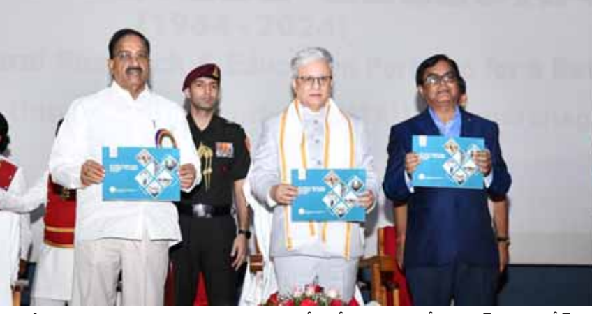
గత కొన్నేళ్లలో ఈ విశ్వవిద్యాలయం వెనుకబాటు కిరీ అయింది అని... దాని అధిగమించి పూర్వ వైభవం తీసుకురావాలని కృషి చేయాలని పిలుపునిచ్చారు. ఈ చారిత్రాత్మక సందర్భాన్ని ఉపయోగించుకుని పరిశోధన, విస్తరణ విద్యలో ముందుకెళ్లాలని మంత్రి సూచించారు. రానున్న రోజుల్లో వ్యవసాయ విశ్వవిద్యాలయం మొదటి 10 ర్యాంకుల్లో నిలవాలని తుమ్మల నాగేశ్వరరావు ఆంక్షించారు. రాష్ట్ర ప్రభుత్వం తరఫున వ్యవసాయ విశ్వవిద్యాలయానికి అన్ని విధాల తోడ్పాటు అందిస్తుందన్నారు. ప్రతి వ్యవసాయ కళాశాల పరిధిలో ఒక 'మోడల్ అగ్రికల్చర్ ఫార్మ్' ను అభివృద్ధి చేయాలన్నారు. వాతావరణ మార్పుల కనుగుణంగా కలి కలమ్ లో రీసెర్చ్ లో మార్పులు తీసుకురావాలని, ఆర్థిక పరిష్కారం, డిజిటల్ టెక్నాలజీలను వినియోగించుకోవాలని తుమ్మల నాగేశ్వరరావు సూచించారు. వజ్రోత్సవ ఉత్సవాల ప్రారంభ

లాల్ బహదూర్ శాస్త్రి చేతల మీద ప్రారంభమైన ఈ విశ్వవిద్యాలయం వాతావరణ మార్పులు వంటి కొత్త సవాళ్లను ఎదుర్కొని మంచి భవిష్యత్తు దిశగా అడుగులు వేసేందుకు ప్రతి ఒక్కరు కృషి చేయాలని గవర్నర్ జిష్ణుదేవ్ చర్ల అన్నారు. ఉదయం ఉత్సాహ ప్రారంభ సందస్సులోనూ, స్పోర్ట్స్ కాంప్లెక్స్ లో నిర్వహించిన కిసాన్ మేళా లోనూ తుమ్మల నాగేశ్వరరావు రైతులని ఉద్దేశించి ప్రసంగించారు. 60 ఏళ్ల చరిత్ర కలిగిన విశ్వవిద్యాలయం భవిష్యత్తులో దేశానికి దిక్సూచిగా మారాలన్నారు. వాతావరణ మార్పులకు అనుగుణంగా డిమాండ్ ఉన్న వంటలు, మన నేల సృజనానికి తగ్గట్టుగా అనుభవ పంటలు, అందుకు అవసరమైన సాంకేతిక సలహాలు, సూచనలను రైతులకు అందించాలని విశ్వవిద్యాలయం శాస్త్రవేత్తలకి ఆయన సూచించారు. ముఖ్యమంత్రి రేవంత్ రెడ్డి రైతు వ్యవసాయ సంక్షేమానికి పెద్ద ఎత్తున నిధులు కేటాయిస్తున్నారన్నారు. రైతు బీమా, రైతు రుణమాఫీలతో పాటు సంక్రాంతి తర్వాత రైతు భరోసాను అమలు చేస్తామన్నారు. పబ్లిక్ ల్యూర్, వంటలు, కూరగాయలు పాపాయిల్ సాగు పెరగాలన్నారు. బిందు, తుంపర సేద్యం, వ్యవసాయ యాంత్రీకరణ పనిముట్లు, శీతల గిడ్డంగుల నిర్మాణానికి చేయూతనిస్తామన్నారు. భవిష్యత్తులో పెద్ద సంఖ్యలో వ్యవసాయ పట్టణాలు రావాలని వ్యవసాయ రంగంలో అధిక జనాభా నిమగ్నం కావాలని తుమ్మల ఆంక్షించారు. దేశ ప్రధానుల చేతుల మీద ప్రారంభమైన విశ్వవిద్యాలయం రైతాంగానికి ఎల్లప్పుడూ చేదోదాహోదగా ఉందని ఆయన అన్నారు.