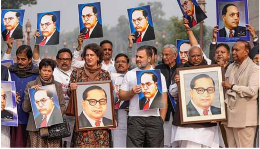
న్యూఢిల్లీ : కేంద్ర హోం మంత్రి అమిత్ షా క్షమాపణలు చెప్పాలంటూ ప్రతిపక్ష కూటమి ఇండియా బ్లాక్ బుధవారం పార్లమెంట్ ఆవరణలో

నిరసన చేపట్టింది. కాంగ్రెస్ పార్టీ అధ్యక్షుడు మల్లికార్జున్ ఖర్గే, రాహుల్ గాంధీ, ప్రయాంక సహా పలువురు ఎంపిలు ఈ నిరసనలో పాల్గొన్నారు. అంజేద్ దుర్ చిత్రపటాలతో