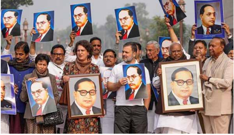
న్యూఢిల్లీ : కేంద్ర హోం మంత్రి అమిత్ షా క్షమాపణలు చెప్పాలంటూ ప్రతిపక్ష కూటమి ఇండియా బ్లాక్ బుధవారం పార్లమెంట్ ఆవరణలో