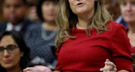
బెర్లిన్ : జర్మనీ పార్లమెంట్ లో సోమవారం జరిగిన విశ్వాస పరీక్షలో ఛాన్సలర్ ఓలాఫ్ స్కోట్ల ఓటమి చరిత్రాకారం. మొత్తం 733 మంది సభ్యులు ఉన్న దిగువ సభలో ఓలాఫ్ స్కోట్లకు అనుకూలంగా కేవలం 207 మంది మాత్రమే ఓటు వేశారు. వ్యతిరేకంగా 394 మంది ఓటు వేశారు. మరో 116 మంది సభ్యులు గైర్జరయ్యారు. దీంతో గెలవడానికి అవసరమైన 367 మెజారిటీ స్కోట్ల చాలా దూరంలో నిలిచారు. నవంబర్ 6న మూడు పార్టీల కూటమి ప్రభుత్వం కుప్పకూలిన నేపథ్యంలో ఈ విశ్వాస పరీక్ష నిర్వహించారు. నవంబర్ 6న వివిధ పార్టీల నాయకులు ఏడు నెలల మందుగానే అంతే ఫిబ్రవరి 23న పార్లమెంట్ ఎన్నికలకు నిర్వహించడానికి అంగీకరించారు. స్కోట్ల ఓటమితో ఈ ఎన్నికలు మరింత ముందుగా జరిగే అవకాశం ఉంది. స్కోట్ల ఓటమితో పార్లమెంట్ ను రద్దుచేసి ఎన్నికలను నిర్వహించాలా.. వచ్చే అసెంబ్లీ అధ్యక్షులు ప్రాంక్-వాలర్ స్టెయిన్మీర్ నిర్ణయం తీసుకోవచ్చు. ఇందుకోసం అధ్యక్షుల ముందు 21 రోజుల సమయం ఉంది.