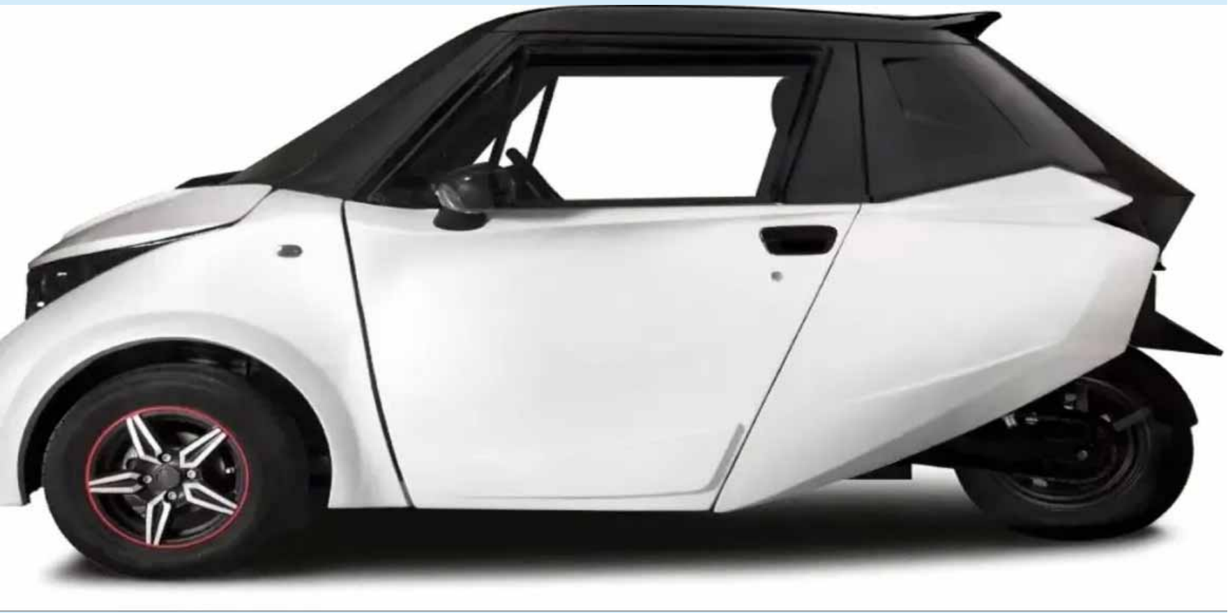
సామాన్యులకు కూడా అందుబాటు ధరలో లభించడం, మెరుగైన రేంజ్ కారణంగా అందరికీ దీనిపై ఆసక్తి నెలకొంది. అలాగే డిజైన్ కూడా చాలా అద్భుతంగా ఉంది. మూడు చక్రాలలో చాలా అందంగా తీర్చిదిద్దారు. మరి ఈ కారును మార్కెట్లోకి వచ్చిన తర్వాత వినియోగదారులను ఏ మేరకు మెప్పిస్తుందో చూడాలి మరి.