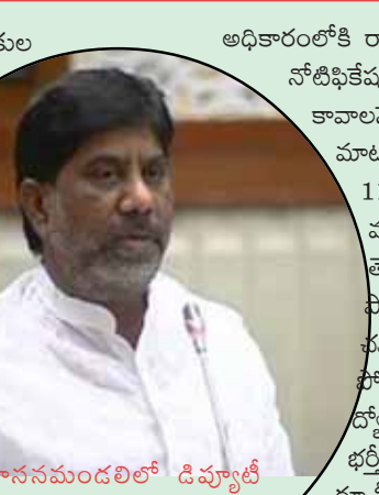
శాసనమండలిలో డిప్యూటీ సీఎం భట్టి విక్రమార్కు మల్లు

అధికారంలోకి రాగానే పాత ఖాళీలు కొత్తవి కలిపి గ్రూప్ వన్ నోటిఫికేషన్ విడుదల చేశాము. ఈ పరీక్షలను ఆపాలని కావాలనే కొద్దిమంది కోర్కెలు వెళ్లారు కానీ మేము ఇచ్చిన మాట ప్రకారం 563 పోస్టులకు పరీక్ష నిర్వహించాము, 11062 ఖాళీలతో డిఎస్సీ నిర్వహించి 10, 600 మందికి అపాయింట్మెంట్ ఆర్డర్లు ఇచ్చామని తెలిపారు. ఉద్యోగ నియామక పరీక్షలన్నీ సారధర్లుగా, ప్రశ్నాపత్రం లీక వంటివి లేకుండా నూనుకుంటూ ఖాళీలను భర్తీ చేసుకుంటూ పోతున్నామని వివరించారు. ఖాళీగా ఉన్న ఉద్యోగాలు జాబ్ క్యాలెండర్ ప్రకారం దశలవారీగా భర్తీ చేసుకుంటూ ముందుకు పోతాం అన్నారు. ఉర్దూ మీడియం లో బ్యాంక్ పోస్టుల భర్తీకి డి రిజర్వేషన్ విధానం పరిశీలించాలని కొందరు సభ్యులు అడిగారు కానీ అందుకు అవకాశం లేదని తెలిపారు.