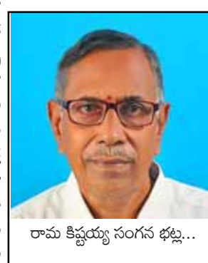
రామ కిష్టయ్య సంగం భట్ల...