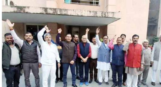
సోయాదా : ఉత్తరప్రదేశ్ లో విద్యుత్ ప్రైవేటీకరణకు వ్యతిరేకంగా నిరసనలు కొనసాగుతున్నాయి. మంగళ వారం సోయాదా, ఘజియాబాద్ లో 4 వేలకు పైగా ఉద్యోగులు నల్ల బ్యాడ్జిలతో

విధులకు హాజరయ్యారు. పూర్వాయల్ విద్యుత్ విత్రేణ్ నిగం లిమిటెడ్ (పిఎంఎల్ఎల్ఎల్), దక్షిణాయల్ విద్యుత్ విత్రేణ్ నిగం లిమిటెడ్ (డివిఎల్ఎల్ఎల్) అనే రెండు డిస్కోలను ప్రైవేటీకరణకు ఉత్తర ప్రదేశ్ పవర్ కార్పొరేషన్ లిమిటెడ్ (యుపిసిఎల్) అనుమతి ఇవ్వడాన్ని వ్యతిరేకిస్తూ ఉద్యోగులు ఈ చర్యకు దిగారు. యుపి విద్యుత్ కర్మాచారి సంయుక్త సంఘర్షణ సమితి (వికెఎస్ఎస్ఎస్) నేతృత్వంలో ఉద్యోగులు నిరసనలు చేపడుతున్నారు. మరో వైపు నిరసనలు అణిచివేయడానికి యుపి ప్రభుత్వం నిరంకుశ చర్యలకు దిగుతుంది. యుపిఎల్, దాని ఐదు అనుబంధ సంస్థల ఉద్యోగులు ఆరు నెలల పాటు సమ్మెలు చేయకుండా యుపి ప్రభుత్వం నిషేధించింది. ఎన్ఐఎల్ నర్సిస్ మెయింటెనెన్స్ యాక్ట్ (ఎన్ఐఎ) నిబంధనల కింద ఈ నిషేధ ఉత్తరాలు జారీ చేసింది.