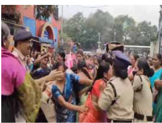
పట్టించుకోకుండా, దౌర్జన్యంగా వ్యాసుల్ ఎత్తేశారని పేర్కొన్నారు. ఆశా పర్యర్థ స్పృహ తప్పిపోయిందని చెప్పినా కూడా పట్టించుకోకుండా, గంట సేపు ఆసుపత్రికి తీసుకెళ్ళకుండా సీట్లో తిప్పారు. ఇంకో ఆశా పర్యర్థ కూడా