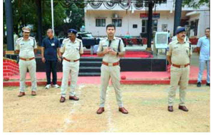
అన్నారు.వివిధ సమస్యలతో పోలీసు స్టేషన్ కు వచ్చే బాధితులకు క్షేత్రస్థాయిలో పరిశీలించి వారికి న్యాయం జరిగే విధంగా డైరెక్టు, భరోసా కల్పించి పోలీస్

నల్లగొండ డిసెంబర్ 09(పుదయం ప్రతినిధి): తెలంగాణ రాష్ట్ర ప్రభుత్వం నిర్వహించిన పోలీసు రిక్రూట్మెంట్ నందు ఉద్యోగం పొంది 9 నెలల శిక్షణ పూర్తి చేసుకొని జిల్లాకు వచ్చిన 290 మంది నూతన పోలీస్ కానిస్టేబుల్స్ కు పోలీసు స్టేషన్ల వారిగా విధుల నియామక పత్రాలను అందించారు. నియామక పత్రాల పొందిన నూతన కానిస్టేబుల్ లకు ఎస్పీ గారు శుభాకాంక్షలు తెలిపి మాట్లాడుతూ సమాజంలో పోలీసు విధులు అనేవి చాలా ప్రత్యేకమైనవి, విధుల నిర్వహించే సమయంలో సమాజం దృష్టి పోలీసు పై ఉంటుంది కావున చక్కని యానిఫాం లో క్రమశిక్షణతో, బాధ్యతగా తమకు అప్పగించిన విధులు నిర్వహించాలి