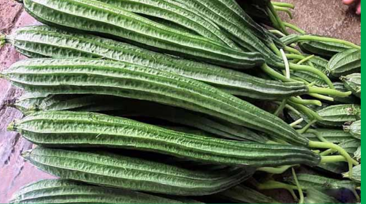
శ్రీ రాడికల్స్ నుంచి చర్మ్యాన్ని రక్షిస్తాయి. బీరకాయలో ఉండే సిలికా అనే ఖనిజం చర్మం, జుట్టు, గోళ్లు ఆరోగ్యంగా ఉంచేందుకు దోహదం చేస్తుంది. బీరకాయను క్రమం తప్పకుండా తీసుకోవడం వల్ల చర్మ సమస్యలు తీరిపోయి చర్మ సౌందర్యం పెరుగుతుందని పోషకాహార నిపుణులు చెబుతున్నారు.

షుగర్ స్థాయిలను నియంత్రించడంలో బీరకాయ ఎంతో మేలు చేస్తుంది. బీరకాయలో చరండ్రిన్ అనే పదార్థం ఉంటుంది. ఇది రక్తంలోని షుగర్ స్థాయిలు అదుపులో ఉండేలా చేస్తుంది. బీరకాయలో ఉండే పీచు పదార్థం రక్తంలోని షుగర్ లెవెల్స్ అక్కణ్ణుకంగా పెరగడాన్ని నివారిస్తుంది. బీరకాయలో ఉండే మంచి మొత్తంలో పీచు ఉంటుంది. ఇది జీర్ణక్రియను మెరుగుపరచడంలో సహాయపడుతుంది. మలబద్ధకం నుండి ఉపశమనం కలిగిస్తుంది. బరువును తగ్గించడంలో బీరకాయ సహాయపడుతుంది. ఆకలిని తగ్గించడమే కాకుండా అతిగా తినడాన్ని నివారిస్తుంది.. శరీరంలోని అదనపు నీటిని తొలగిస్తుంది. దీంతో శరీర బరువు తగ్గేందుకు దోహదం చేస్తుంది. అధిక బరువుతో ఇబ్బంది పడేవారు తరచూగా బీరకాయ తీసుకోవడం వల్ల లాభం ఉంటుంది. బీరకాయలో కొవ్వులు తక్కువగా ఉంటాయి. రోగ నిరోధక శక్తిని వదిలివేయడం చేయడానికి బీరకాయ చాలా ఉపయోగపడుతుంది. బీరకాయలో ఉండే విటమిన్ సి రోగ నిరోధక శక్తిని పెంచుతుంది. అలాగే బీరకాయలో జింక్, ఐరన్, పొటాషియం విటమిన్లతో పాటు ఎన్నో ఖనిజాలు ఉంటాయి. ఇవి రోగనిరోధక వ్యవస్థను మరింత మెరుగుపరుస్తాయి. బీరకాయ చర్మ ఆరోగ్యాన్ని కూడా మెరుగుపరుస్తుంది. వ్యధావ్యసం కలిగిన వారు దూరం చేస్తుంది. బీరకాయలో ఉండే విటమిన్ సి, కెలటన్ వంటి యాంటీఆక్సిడెంట్లు