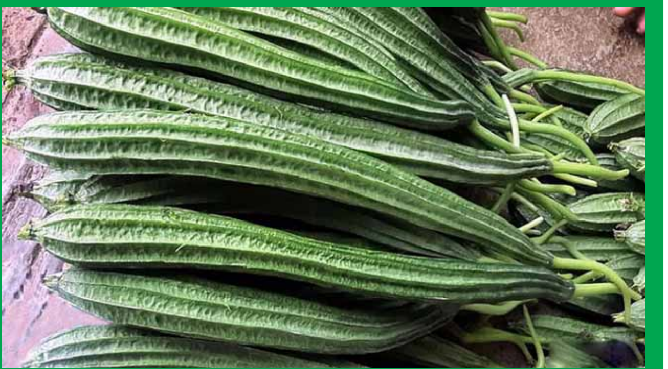
శ్రీ రాడికల్స్ నుంచి చర్మాన్ని రక్షిస్తాయి. బీరకాయలో ఉండే సింకా అనే ఖనిజం చర్మం, జుట్టు, గోళ్లు ఆరోగ్యంగా ఉంచేందుకు దోహదం చేస్తుంది. బీరకాయను క్రమం తప్పకుండా తీసుకోవడం వల్ల చర్మ సమస్యలు తీరిపోయి చర్మ సౌందర్యం పెరుగుతుందని పోషకాహార నిపుణులు చెబుతున్నారు.

బీరకాయ బెనిఫిట్స్ తెలిస్తే వదిలిపెట్టరు బీరకాయలో ఉండే విటమిన్ సి రోగ నిరోధక శక్తిని పెంచుతుంది. అలాగే బీరకాయలో జింక్, బి6, పొటాషియం విటమిన్లు పాటు ఎన్నో ఖనిజాలు ఉంటాయి. ఇవి రోగనిరోధక వ్యవస్థను మరింత మెరుగుపరుస్తాయి. ముఖ్యంగా బీరకాయతో కలిగి ప్రయోజనాల్లో.. బీరకాయ బెనిఫిట్స్ తెలిస్తే వదిలిపెట్టరు.. ఇమ్మ్యూనిటీ పెరగడంతో పాటు, గుండెకు కూడా మంచిదే..! ఎన్నో అనారోగ్య సమస్యలను దూరం చేసే పోషకాలు కూడా బీరకాయలో ఉంటాయి. అలాంటి కూరగాయల్లో బీరకాయ కూడా ఒకటి. బీరకాయలో తక్కువ కేలరీలతో పాటు ఫైబర్ సమృద్ధిగా ఉంటుంది. ఇందులో యాంటీఆక్సిడెంట్లతో పాటు విటమిన్లు, ఖనిజాలు పుష్కలంగా లభిస్తాయి. బీరకాయ జీర్ణక్రియను మరింత మెరుగ్గా పనిచేసేలా చేస్తుంది. రోగనిరోధక శక్తిని పెంచడంలో బీరకాయ ఎంతో మేలు చేస్తుంది.. బీరకాయ తీసుకోవడం వల్ల కలిగే ముఖ్యమైన ఆరోగ్య ప్రయోజనాల గురించి ఇక్కడ తెలుసుకుందాం.. బీరకాయలో నీరు, ఫైబర్ కంటెంట్ అధికంగా ఉంటుంది. బీరకాయలో విటమిన్ ఏ, సి, బి6, మెగ్నీషియం, విటమిన్ బి6, పొటాషియం, సోడియం లభిస్తాయి. ఇందులో మంచి మొత్తంలో పొటాషియం ఉంటుంది. గుండె ఆరోగ్యానికి మేలు చేస్తుంది. రక్తపోటును నియంత్రిస్తుంది. గుండె ఇబ్బంది ప్రమాదాన్ని తగ్గిస్తుంది. మధుమేహం బాధితుల్లో రక్తంలోని