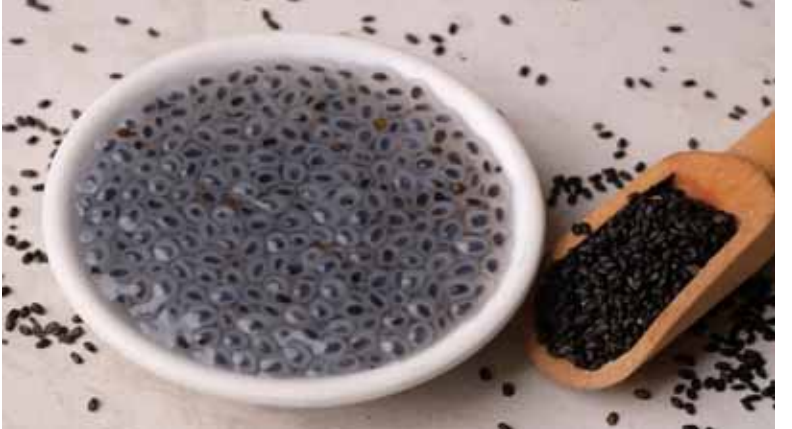
విత్తనాలు మధుమేహాలకు మంచి హెంపింగ్ చేబుతున్నారు. సబ్జా విత్తనాల్లో ప్రోటీన్, ఫైబర్, ఆరోగ్యకరమైన కొవ్వులు, కార్బోహైడ్రేట్లు పుష్కలంగా ఉన్నాయి. మీరు తరచుగా మలబద్ధకంతో బాధపడుతుంటే, ప్రతిరోజూ సబ్జా గింజలను తినండి. ఇందులో పీచు పుష్కలంగా ఉండి మలబద్ధకాన్ని దూరం చేస్తుందని చెబుతున్నారు. మధుమేహంతో బాధపడేవారు సబ్జా గింజలను తీసుకోవచ్చు. వీటిని నీళ్లలో నానబెట్టుకుని తాగటం వల్ల మంచి ఫలితాలను పొందుతారు. ఖాళీ కడుపుతో సబ్జా నీటిని తాగటం వల్ల ఫలితం ఉంటుంది. శరీరంలోని బ్లడ్ షుగర్ లెవెల్స్ కంట్రోల్లో ఉంచడంలో సహాయపడుతుంది. తక్కువ నీరు త్రాగడం, సరైన జీవనశైలి కారణంగా యూరినరీ ట్రాక్ట్ ఇన్ఫెక్షన్ వస్తుంది. సబ్జా గింజలు వీలైనంత ఎక్కువ నీరు త్రాగడమే కాకుండా మూత్రనాళ ఇన్ఫెక్షన్లను దూరం చేస్తాయి. అంతేకాదు.. తలనొప్పి, గొంతులో మంట, అసహనం, తీవ్రమైన జ్వరం వంటి అనేక సమస్యల నుంచి సబ్జా గింజలు ఉపశమనం కలిగి నీళ్లలో సబ్జా గింజలను నానబెట్టుకొని, వాటిని తినేయాలని చెబుతున్నారు.

శరీరంలోని బ్లడ్ షుగర్ లెవెల్స్ కంట్రోల్లో ఉంచడంలో సహాయపడుతుంది. తక్కువ నీరు త్రాగడం, సరైన జీవనశైలి కారణంగా యూరినరీ ట్రాక్ట్ ఇన్ఫెక్షన్ వస్తుంది. సబ్జా గింజలు వీలైనంత ఎక్కువ నీరు త్రాగడమే కాకుండా.. చెడు ఆహారపు అలవాట్లు, అసవ్యమైన జీవనశైలి కారణంగా అనేక రోగాలు ప్రజలను వెంటాడుతున్నాయి. ప్రస్తుతం చాలా మంది ప్రజలు మధుమేహం, మలబద్ధకం వంటి సమస్యలను ఎక్కువగా ఎదుర్కొంటున్నారు. చిన్నవయసులోనే చాలా మంది మధుమేహం బారినపడుతున్నారు. నీరు, సరైన ఫైబర్ ఆహారాలు లేకపోవడం వల్ల మలబద్ధకం సమస్యతో ఇబ్బంది పడుతున్నారు. ఇటువంటి సమస్యలను తగ్గించడానికి లేదా ఉపశమనం పొందడానికి ఇంటి నివారణలు చక్కటి ఫలితాలను ఇస్తాయని ఆరోగ్య నిపుణులు చెబుతున్నారు. ఆయుర్వేదంలో చాలా ప్రయోజనకరంగా భావించే సబ్జా గింజలతో మధుమేహం, మలబద్ధకాన్ని ఎలా నివారించవచ్చో ఇక్కడ తెలుసుకుందాం.. మధుమేహం నయం కాదు. కాని కొన్ని ఇంటి చిట్టెలు, ఆయుర్వేద ఔషధాలు తీసుకోవడం వల్ల బ్లడ్ షుగర్ ను అదుపులో ఉంచుకోవచ్చునని వైద్య నిపుణులు చెబుతున్నారు. అందులో ముఖ్యంగా సబ్జా