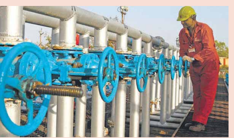
పారాల సగటు చమురు ధరల ఆధారంగా ప్రతి 15 రోజులకోసారి ఈ పన్నులను కేంద్రం సమీక్షిస్తోంది. అంతర్జాతీయంగా చమురు ధర గత కొన్ని నెలలుగా 72-75 డాలర్ల మధ్య కదలాడుతోంది.

చమురు ఉత్పత్తులపై మోడీ సర్కార్ విండోఫాల్ ట్యాక్స్ను రద్దు చేసింది. పెట్రోల్, డీజిల్, ఎవియేషన్ టర్బైన్ ఫ్యూయల్, ఇతర చమురు ఉత్పత్తుల ఎగుమతులపై విధిస్తున్న విండోఫాల్ ట్యాక్స్ను రద్దు చేయడం ద్వారా రిలయన్స్ ఇండస్ట్రీస్, ఓఎన్జిసి సంస్థలకు ఆదాయాలు పెరగనున్నాయి. సోమవారం ఈ పన్నులను ప్రధాన మంత్రి కార్యాలయం నుండి నిర్ణయం తీసుకుంది. అంతర్జాతీయంగా చమురు ధరలు తగ్గుముఖం పట్టడంతో ఈ నిర్ణయం తీసుకున్నట్లు సమాచారం. చమురు ఉత్పత్తుల ఎగుమతులపై 2022 జూలై 1 నుంచి కేంద్రం విండోఫాల్ ట్యాక్స్ అమలు చేస్తోంది. అంతర్జాతీయంగా ముడిచమురు ధరలు పెరిగినప్పుడు ఆయా కంపెనీలకు పెద్దఎత్తున లాభాలు వస్తాయి. ఆ సమయంలో ఎంపీసీ పన్నునే విండోఫాల్ ట్యాక్స్గా పేర్కొంటారు. రెండు