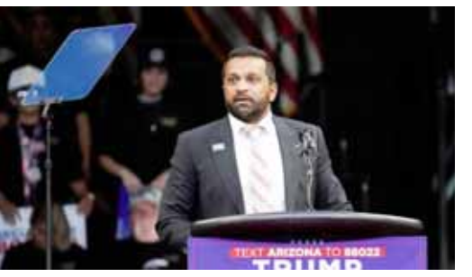
చెందినవారు. తల్లి టాంజానియా, తండ్రి ఉగాండాకు చెందినవారు. 1970లో కెనడా నుండి అమెరికాకు వలస వచ్చారు. న్యూయార్క్ లో జన్మించిన కళ్లవే యూనివర్సిటీ ఆఫ్ రిచీమోండ్ లో గ్రాడ్యుయేషన్ పూర్తి చేసి, యూనివర్సిటీ కాల్జే లండన్ లో న్యాయవిద్యను పూర్తి చేశారు. మియమీ కోర్ట్ లో పబ్లిక్ డిఫెండర్ గా పనిచేసి వివిధ హోదాల్లో సేవలందించారు.

వాషింగ్టన్: అమెరికా అధ్యక్షుడిగా ఎన్నికైన ట్రంప్ తన సన్నిహితుడు కామ్ పీట్ ల్ (కళ్లవే పట్ల) ను డైరెక్టర్ బ్యాండ్ ఆఫ్ ఇన్వెస్టిగేషన్ (ఎఫ్ బిఐ) డైరెక్టర్ గా శనివారం ఎంపిక చేశారు. తన యంత్రాంగంలో పలువురు భారత సంతతికి చెందిన వ్యక్తులకు కీలక పదవులను కేటాయిస్తున్న సంగతి తెలిసిందే. "ఎఫ్ బిఐ తదుపరి డైరెక్టర్ గా కామ్ పీట్ ల్ (కళ్లవే) పట్లను ఎంపిక చేసినందుకు నేను గర్వపడుతున్నాను. గొప్ప న్యాయవాది, పరిశోధకులు, అమెరికా మొదటి పోరాట యోధుడు. అమెరికా ప్రజల కోసం తన వృత్తిని అంకితం చేశారు" అని ట్రంప్ సొంత సోషల్ మీడియా 'ట్రూత్ లో టాక్' చేశారు. గతంలో ట్రంప్ ప్రభుత్వంలో అమెరికా తాపాలిక్ రక్షణ కార్యదర్శి చీఫ్ ఆఫ్ స్టాఫ్ గా పనిచేశారు. నేషనల్ రిజర్వ్ డిప్యూటీ డైరెక్టర్, నేషనల్ సెక్యూరిటీ కౌన్సిల్ (ఉగ్రపాదం) సీనియర్ డైరెక్టర్ గా పనిచేశారు. న్యూయార్క్ లో జన్మించిన కళ్లవేకు గుజరాత్ మూలాలున్నాయి. ఆయన తల్లిదండ్రులు తూర్పు ఆఫ్రికాకు