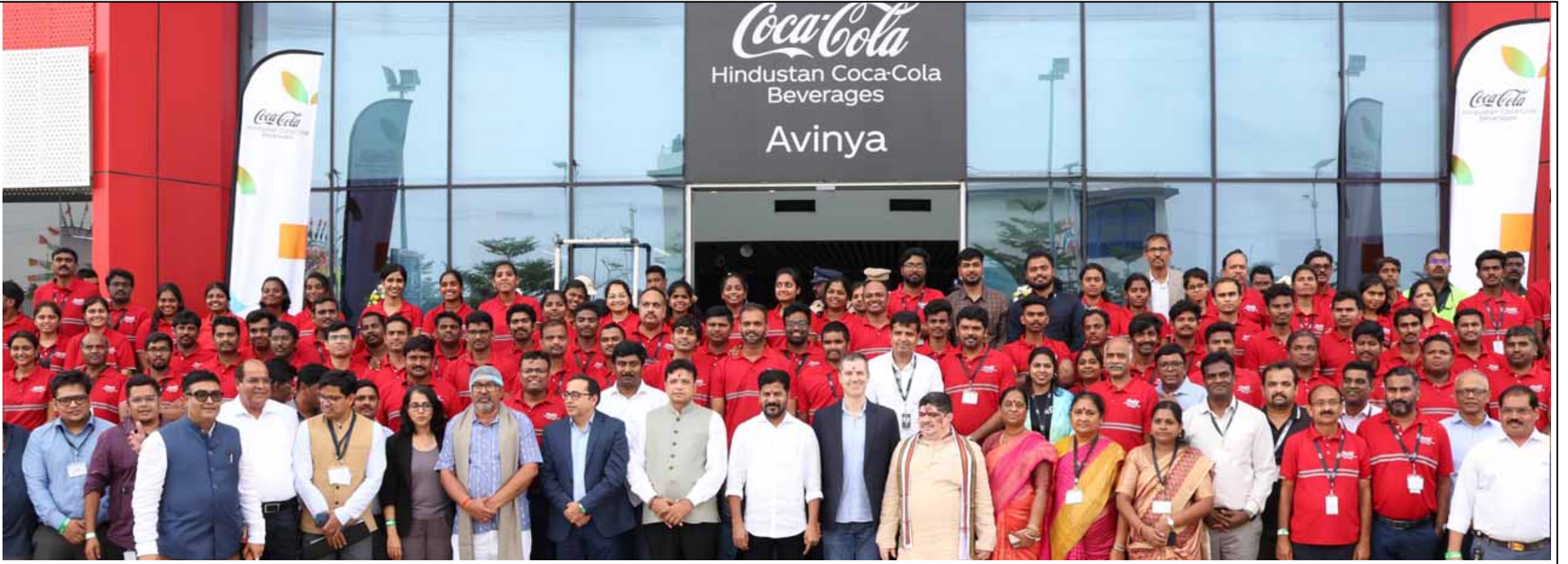
సిద్దిపేట జిల్లా బండ తిమ్మాపూర్ లో హిందుస్థాన్ కోకోలా బెవేరేజెస్ ని ప్రారంభించిన ముఖ్యమంత్రి రేవంత్ రెడ్డి

సంపుటి : 25 || సంచిక : 260 || హైదరాబాద్ || మంగళవారం, డిసెంబర్ 03, 2024 || VOODAYAM Telugu Daily || వల : రూ. 3.00 || పేజీలు : 12