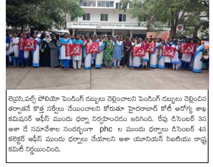
తెలంగాణ ప్రభుత్వం పేరిట జరిగిన కార్యక్రమంలో కేసీఆర్ కార్యకర్తలను వేధిస్తే ఊరుకాబోము అనే నినాదాలను పాఠశాల పిల్లలకు బోధించేలా పబ్లికాన్స్ పాఠశాలలో కార్యక్రమం జరిగింది. రేపు డిసెంబర్ 3న ఆసా దే సమావేశాల సందర్భంగా phc ల ముందు ధర్మాలు డిసెంబర్ 4న కలెక్టర్ ఆఫీస్ ముందు ధర్మాలు చేయాలని ఆసా యూనియన్ సిబిఐయూ రాష్ట్ర కమిటీ నిర్ణయించింది.

కేసీఆర్ ను సీఎం మొక్క అనడం హాస్యాస్పదం కేసీఆర్ మొక్క కాదు... వేగు చుక్క రేవంత్ రెడ్డి గురువులకే చుక్కలు చూపించి తెలంగాణ తెచ్చిన శక్తి కేసీఆర్ కోరుట్ల బీఆర్ఎస్ కార్యకర్తలతో ఎమ్మెల్సీ కవిత భేటీ మాదీ ప్రభుత్వం చేనేతపై జీఎస్టీ విధించడం దౌర్భాగ్యం తెలంగాణ అధికారంలోకి వస్తే చేనేతపై జీఎస్టీని రియంబర్స్ చేస్తామన్న రాహుల్ గాంధీ హామీ ఏమైంది ? బి ఎమ్మెల్సీ కవితను కలిసిన అఖిల భారత పద్మశాలి సంఘం నాయకులు