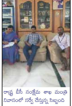
రాష్ట్ర బీసీ సంక్షేమ శాఖ మంత్రి నివాసంలో సర్వే చేస్తున్న సిబ్బంది