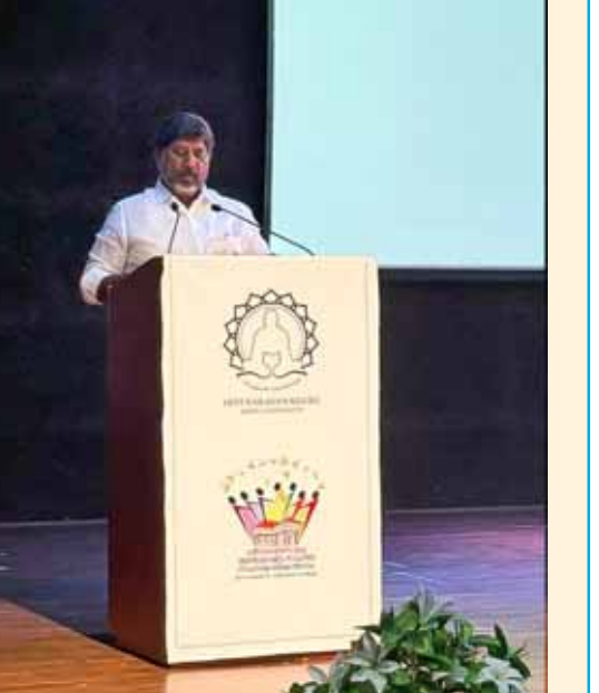
భారతదేశానికి ఉన్న ప్రత్యేకతను కూడా ఉజ్వలంగా నిలిపే బాధ్యతను మనందరం నిర్వహించిస్తూ అవుతుందని తెలిపారు.

సమానత్వం కలిగిన ఒక రాష్ట్రంగా తీర్చిదిద్దడంలో నారాయణ గురు పాత్ర ఎవలెనీ అని పేర్కొన్నారు. తెలంగాణ, కేరళ రాష్ట్రాల మధ్య అలోచనల్లో సారూప్యత ఉందని తెలిపారు. తెలంగాణలో కొమరం భీం, చాకలి బలము నారాయణ గురు తరహాలోని సమానత్వం కోసం తిరుగుబాటు చేశారని వివరించారు. ఈ రెండు ప్రాంతాలు సమానత్వం, న్యాయానికి ప్రాతినిధ్యం వహిస్తున్నాయి అని తెలిపారు. ఆధునిక భారతదేశంలో విభజనలపై నారాయణ గురు సమైక్యత సందేశం మరింత కీలకంగా మారింది అన్నారు. ఆయన చూపిన మార్గంలో మనం ముందుకు సాగాలి సామాజిక, ఆర్థిక సమాజం దీటుగా ఎదుర్కోవాలని డిప్యూటీ సీఎం భట్టి విక్రమార్క మల్లు పలుకుచున్నారు. నారాయణ గురు కేవలం ఒక కల మాత్రమే కనలేదు, ఆ కలను నిజం చేసేందుకు సాహసోపేతమైన చర్యలు తీసుకున్నారని తెలిపారు. ఇప్పుడు మన కర్తవ్యం ఆయన వారసత్వాన్ని ముందుకు తీసుకెళ్లడం, విభజనలను అధిగమించి ప్రతి ఒక్కరూ న్యాయంగా గౌరవంగా జీవించే సమాజాన్ని నిర్మించడంలో కీలక పాత్ర పోషించాలని పిలుపునిచ్చారు. నారాయణ గురు జీవిత స్ఫూర్తిని మనమంతా స్ఫూరించి సమానత్వం, న్యాయం, మానవత్వం కలిగిన సమాజాన్ని నిర్మిద్దాం అని అన్నారు. ఈ విధంగా మనం కేవలం ఆయనకు గౌరవం ఇవ్వడమే కాదు మన