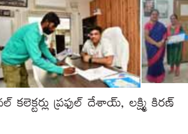
సర్వే వివరాలను సమీక్షించే సందర్భంగా మున్సిపల్ కార్యాలయాలు, మండల కేంద్రాల్లోని తహసీల్ కార్యాలయాలు, ఎంపీఎస్ కార్యాలయాల్లో ఏర్పాటు చేసిన సర్వే కేంద్రాలకు సేవలందించారు. దాటా ఎంపీఎస్ ఆఫీసర్లు సర్వేకు సంబంధించిన వివరాలన్నీ సమీక్షించే సందర్భంగా మున్సిపల్ కార్యాలయాలు, మండల కేంద్రాల్లోని తహసీల్ కార్యాలయాలు, ఎంపీఎస్ కార్యాలయాల్లో ఏర్పాటు చేసిన సర్వే కేంద్రాలకు సేవలందించారు. దాటా ఎంపీఎస్ ఆఫీసర్లు సర్వేకు సంబంధించిన వివరాలన్నీ సమీక్షించే సందర్భంగా మున్సిపల్ కార్యాలయాలు, మండల కేంద్రాల్లోని తహసీల్ కార్యాలయాలు, ఎంపీఎస్ కార్యాలయాల్లో ఏర్పాటు చేసిన సర్వే కేంద్రాలకు సేవలందించారు.