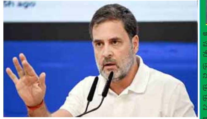
ద్రవ్యోల్బణం 14 నెలల గరిష్ట స్థాయి 6.21 శాతం పెరిగింది. గతేడాది అక్టోబర్ తో పోలిస్తే ఈ ఏడాది బంగారంపలు, ఉల్లభల దాడులు 50 శాతం పెరిగాయి. రూపాయి కనిష్ట స్థాయి 84.50కి చేరుకుంది. నిరుద్యోగం ఇప్పటికీ 45 ఏళ్ల రికార్డును బద్దలు కొట్టింది" అని రాహుల్ అన్నారు. గత ఐదేళ్లలో కూలిలు, ఉద్యోగులు, చిన్న వ్యాపారుల ఆదాయం స్తంభిల్చిపోయింది లేదా గణనీయంగా తగ్గిందని రాహుల్ గాంధీ పేర్కొన్నారు. "మొత్తం అమృతాలలో అందుబాటు ధరల గుర్తించే వాటా గత ఏడాది 38 శాతం నుండి 22 శాతానికి పడిపోయింది. ఎఫ్ఎంసీ ఇజిటీలకు ఇప్పటికీ డిమాండ్ తగ్గిపోయింది. గత 10 ఏళ్లలో కార్పొరేట్ పన్ను వాటా 7 శాతం తగ్గగా, ఆదాయం పన్ను 11 శాతం పెరిగింది. నోట్ల రద్దు, జిఎస్ టీ కారణంగా ఆర్థిక వ్యవస్థలో తయారీ రంగ వాటా 50 ఏళ్లలో కనిష్టంగా 13 శాతానికి పడిపోయింది. ఇటువంటి పరిస్థితిలో, కొత్త ఉద్యోగ అవకాశాలు ఎలా సృష్టించబడతాయి?" అని రాహుల్ గాంధీ ప్రశ్నించారు.

న్యూ డిల్లీ డిసెంబర్ 1 : భారత స్థూల జాతీయోత్పత్తి (జిడిపి) వృద్ధి రేటు రెండేళ్ల కనిష్ట స్థాయికి పడిపోయి 5.4 శాతానికి చేరుకుందని లోక్ సభలో ప్రతిపక్ష నేత రాహుల్ గాంధీ ఆదివారం అన్నారు. రైతులు, కార్మికులు, మధ్యతరగతి, పేదలు ఆర్థికంగా అవస్థలు ఎదుర్కొంటుంటే, ప్రయోజనాలు కొంతమంది బిలియనీర్లకే పరిమితమైతే భారత ఆర్థిక వ్యవస్థ పురోగమించడం రాహుల్ గాంధీ స్పష్టం చేశారు. " భారతదేశం స్థూల జాతీయోత్పత్తి వృద్ధి రేటు రెండేళ్ల కనిష్ట స్థాయికి, అంటే 5.4%కి పడిపోయింది. విషయమేమిటంటే భారత ఆర్థిక వ్యవస్థ కేవలం కొద్దిమంది బిలియనీర్లకు మాత్రమే ప్రయోజనాలు అందతున్నంత కాలం రైతులు, కార్మికులు, మధ్యతరగతి మరియు పేదలు వివిధ ఆర్థిక సమస్యలతో పోరాడుతున్నంత కాలం భారత ఆర్థిక వ్యవస్థ పురోగమించదు" అని కాంగ్రెస్ నాయకుడు 'వక్స్'లో (ఇదివరకటి టీవీట్లలో) పోస్ట్ చేశారు. భారతదేశంపై, ఉల్లభల దాడులు 50 శాతం పెరగడంతో రిటైల్ ద్రవ్యోల్బణం 6.21 శాతానికి పెరిగిందని, రూపాయి విలువ 84.50కి పడిపోయిందని రాహుల్ గాంధీ పేర్కొన్నారు. "ఈ వాస్తవాలను పరిశీలించండి, వర్షానికి ఎంత ఆందోళనకరంగా ఉందో గమనించండి. రిటైల్