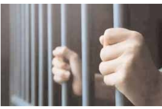
తండ్రిని అరెస్ట్ చేశారు. పోక్స్ చట్టంతోపాటు, ఐపీఎస్, జువెనైల్ జస్టిస్ చట్టంలోని పలు సెక్షన్ల కింద పోలీసులు కేసు నమోదు చేశారు. 2022లో బెయిల్పై విడుదలైన ఆ వ్యక్తి సవతి కుమార్తెపై మళ్లీ లైంగిక దాడికి పాల్పడ్డాడు. దీంతో

తిరువనంతపురం: ఒక వ్యక్తి సవతి కూతురుపై పలు ఏళ్ళుగా అత్యాచారానికి పాల్పడ్డాడు. ఈ విషయం తెలుసుకున్న ఆమె తల్లి పోలీసులకు ఫిర్యాదు చేసింది. దీంతో ఆ వ్యక్తిని అరెస్ట్ చేశారు. విచారణ జరిపిన ఫాస్ట్ ట్రాక్ కోర్టు నిందితుడికి 141 ఏళ్లు జైలు శిక్ష విధించింది. (%మీఠ అ + 141 వూతీ ాతీఠంఠీ అఱవత్తఠవఠఠ%) కేరళలోని మలప్పురం జిల్లాలో ఈ సంఘటన జరిగింది. తమిళనాడుకు చెందిన కుటుంబం పని కోసం కేరళకు వలస వచ్చింది. అయితే 2017 నుంచి 2020 వరకు సవతి తండ్రి సవతి కుమార్తెపై లైంగిక దాడికి పాల్పడ్డాడు. ఆమె తల్లి ఇంట్లో లేనప్పుడు ఆ బాలికపై అత్యాచారం చేసేవాడు. కాగా, బాధిత బాలిక ఈ విషయాన్ని తన స్నేహితురాలికి చెప్పింది. ఆమె సూచనతో సవతి తండ్రి అక్కర్తాలను తల్లికి వివరించింది. దీంతో 2021లో ఆ మహిళ పోలీసులకు ఫిర్యాదు చేసింది. ఈ నేపథ్యంలో సవతి