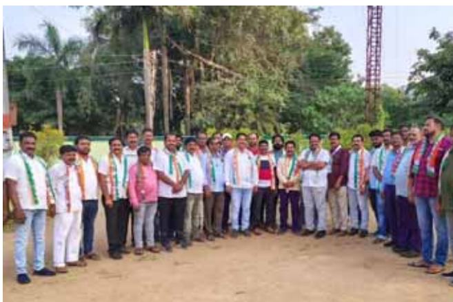
తెలియజేశారు. గుర్తింపు సంఘం ఎన్నికల్లో అనేక హామీలు ఇచ్చినట్టువంటి