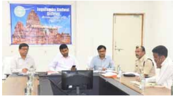
పరీక్షా కేంద్రం లోపలికి మొబైల్ ఫోన్ అనుమతి లేదన్నారు. పరీక్షా కేంద్రంలోకి మొబైల్ ఫోన్, వస్త్రాలు, అనుమతి లేని సామాగ్రిని క్షుణ్ణంగా తనిఖీలు చేపట్టి, కేంద్రంలోకి రాకుండా చూడాలన్నారు. పరీక్షా విధుల నిబ్బంది, అధికారులు కేంద్రానికి ముందస్తుగా చేరుకొని ఏర్పాట్లు పూర్తి చేయాలన్నారు. జిల్లాలో 8570 మంది అభ్యర్థులు గ్రూప్-3 పరీక్షలు వ్రాయనున్నారు, 25 పరీక్షా కేంద్రాలు ఏర్పాటు చేసినట్లు, పరీక్షా కేంద్రాల్లో నిబంధనల మేరకు అన్ని చర్యలు చేపట్టినట్లు తెలిపారు. పరీక్షల విజయవంతానికి కమిషన్ ఆదేశాలు, సూచనల ప్రకారం అన్ని చర్యలు చేపట్టనున్నట్లు కలెక్టర్ అన్నారు. పరీక్షకు హాజరయ్యే అభ్యర్థులు గంట ముందు హాజరుకావాలని ఒక్క నిమిషం ఆలస్యమైన పరీక్షలలోకి అనుమతించ కూడదని అన్నారు. హాల్ టికెట్ తో పాటు ప్రభుత్వం జారీ చేసిన ఏదైనా ఒక గుర్తింపు కార్డు కచ్చితంగా తీసుకొని రావాలన్నారు. ఈ వీడియో కాన్ఫరెన్స్ లో అదనపు కలెక్టర్ నర్సిం రావు, రిజిస్ట్రార్ కో - ఆర్డినరీ రామ్ మోహన్ తదితరులు పాల్గొన్నారు.

గద్వాల నవంబర్ 13 (పుదయం ప్రతినిధి) నవంబర్ 17, 18 తేదీల్లో నిర్వహించనున్న తెలంగాణ పబ్లిక్ సర్వీస్ కమిషన్ గ్రూప్-3 పరీక్షలకు వకద్వంద్విగా ఏర్పాటు చేసే విజయవంతం చేయాలని జిల్లా కలెక్టర్ బి.ఎం.సంతోష్ అన్నారు. బుధవారం తెలంగాణ పబ్లిక్ సర్వీస్ కమిషన్ చైర్మన్ యం. మహేందర్ రెడ్డి పబ్లిక్ సర్వీస్ కమిషన్ సభ్యులతో కలిసి హైదరాబాద్ నుండి వీడియో కాన్ఫరెన్స్ ద్వారా గ్రూప్-3 పరీక్షల నిర్వహణపై జిల్లా కలెక్టర్తో సమీక్ష నిర్వహించారు. ఈ సందర్భంగా జిల్లా కలెక్టర్ మాట్లాడుతూ, అన్ని దశల్లో ఏర్పాట్లలో లోటుపాట్లు లేకుండా జాగ్రత్తలు చేపట్టాలన్నారు. స్టాంప్ రూమ్ ఏర్పాటు పటిష్టంగా చేయాలన్నారు. పరీక్షా కేంద్రాల పద్ద ఏర్పాట్లను శాఖాధికారి, సంబంధిత పరీక్షా కేంద్ర చీఫ్ సూపరింటెండెంట్ తో సమన్వయం చేసుకొని, ఒక రోజు ముందస్తుగా పూర్తి చేయాలన్నారు. త్రాగునీటి వసతి, పారిశుధ్య పనులు చేయాలన్నారు. చీఫ్ సూపరింటెండెంట్ కు తప్ప మరెవరికీ