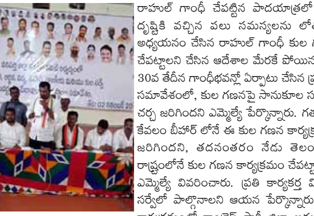
సీనియర్ కార్యకర్తలు, నాయకులు, వివిధ కుల సంఘాల నాయకులు, ప్రజాప్రతినిధులు తదితరులు పాల్గొన్నారు.

వనపర్తి నవంబర్ 02(పుదయం ప్రతినిధి): ఈనెల 6వ తేదీ నుంచి కాంగ్రెస్ ప్రభుత్వం ప్రతిష్టాత్మకంగా చేపట్టిన కుల గణన సర్వేలో కాంగ్రెస్ పార్టీ కార్యకర్తలు నాయకులు తప్పకుండా పాల్గొనాలని వనపర్తి ఎమ్మెల్యే తూడి మేఘారెడ్డి సూచించారు. శనివారం వనపర్తి పట్టణంలోని దాదా లక్ష్మయ్య ఫంక్షన్ హాలులో నిర్వహించిన కుల గణన సర్వేపై అభిప్రాయ సేకరణ కార్యక్రమంలో ఎమ్మెల్యే పాల్గొని మాట్లాడారు. సర్వేలో వనపర్తి నియోజకవర్గం రాష్ట్రానికే రోల్ మోడల్ గా నిలవాలని ఆ విధంగా కాంగ్రెస్ కార్యకర్తలు సర్వే చేపట్టే అధికారుల మమేకమై సర్వే చేయించాలని ఎమ్మెల్యే సూచించారు. సర్వే చేపట్టే అధికారులతో గ్రామాల్లోని కార్యకర్తలు నాయకులు మమేకమవ్వాలని ప్రతి ఒక్కరి వివరాలను పూర్తిస్థాయిలో సమోదు చేసే విధంగా జాగ్రత్తపడాలని