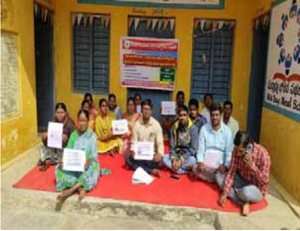
మెదక్, ( 2024 నవంబర్ 30 పుదయం ప్రతినిధి : రామాయంపేట ఎంకా.ఓ. ఆఫీస్ నందు శనివారం సమగ్ర శిక్షా ఉద్యోగుల సంఘం ఆధ్వర్యంలో ఒక్కరోజు నిరసన దీక్ష కార్యక్రమం చేపట్టారు. ఈ సందర్భంగా వారు మాట్లాడుతూ... పాఠశాల విద్యార్థులకు సమగ్ర శిక్షా ఉద్యోగుల రెగ్యులరైజేషన్, తక్షణమే పే స్కేల్ అమలు చేయాలని డిమాండ్ చేస్తూ రాష్ట్ర శాఖ పిలుపువేరకు ఒక రోజు నిరసన దీక్ష కార్యక్రమం చేపట్టినట్లు వారు తెలిపారు. వెంటనే తమ డిమాండ్లను పరిష్కరించాలని వారు కోరారు.