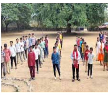
మాట్లాడుతూ కాంగ్రెస్ ప్రభుత్వం ఏర్పడిన నుంచి పుడ్ పాయిజన్ తో 51 మంది విద్యార్థులు చనిపోయారని, ముఖ్యంగా గురుకుల, కేటీవీ, ఆశ్రమ పాఠశాల, ప్రభుత్వ స్కూల్స్ లో తరచుగా పుడ్ పాయిజన్ ఫుటలు జరుగుతున్నాయని, నాణ్యమైన పోషక ఆహారం పెట్టడం లేదని, సంబంధిత విద్యార్థులకు అధికారులు నిత్యం పర్యవేక్షించాలని, ఇప్పటివరకు మంత్రిని

- విద్యార్థులకు నాణ్యమైన పాఠ్యాంశాన్ని అందించడంలో ప్రభుత్వం వెంటనే తగు చర్యలు చేపట్టాలి