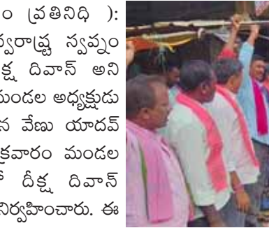
Share On Social Media