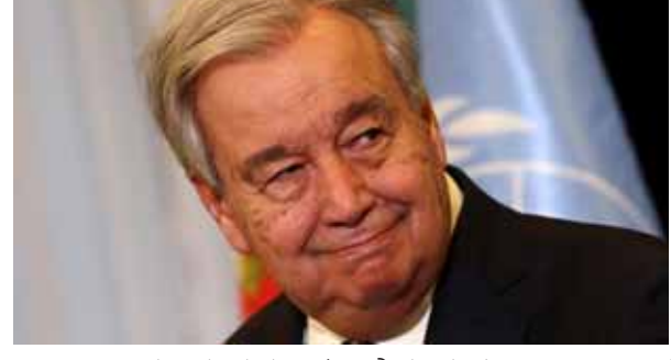
వ్యాఖ్యానించారు. ఈ ఘర్షణలకు అపారమైన మూల్యాన్ని చెల్లించిన సామాన్య పౌరులకు ఇది చాలా కీలకమని పేర్కొన్నారు.

లిస్బన్ : తాజాగా ఇజ్రాయిల్, లెబనాన్ లోని హిజ్బుల్లా మధ్య కుదిరిన కాల్పుల విరమణ ఒప్పందం పశ్చిమసియాను మునుగుకొన్న సంక్షోభం నేపథ్యంలో తొలి ఆశా కిరణమని ఐక్యరాజ్య సమితి సెక్రటరీ జనరల్ అంటానియో గుటెరెస్ వ్యాఖ్యానించారు. ఈ ఒప్పందంలోని ఇరు వజ్రాలు కూడా కాల్పుల విరమణ పట్ల నిబద్ధతను పాటిస్తూ, ఒప్పందాన్ని గౌరవించడం చాలా కీలకమని పేర్కొన్నారు. తన స్వస్థలమైన లిస్బన్ కు వచ్చిన ఆయన టెలివిజన్లో మాట్లాడుతూ ఈ వ్యాఖ్యలు చేశారు. కాల్పుల విరమణ ఎలా అమలువుతోందన్న అంశంపై లెబనాన్ లోని ఐరాన శాంతి పరిరక్షక బలగాలు పర్యవేక్షించడానికి సిద్ధంగా వున్నాయన్నారు. గాజోల్ కూడా తక్షణమే కాల్పుల విరమణ జరగాలని ఆయన కోరారు. నెలల తరబడి అలుముకున్న అంధకారంలో తొలి ఆశా కిరణంగా లెబనాన్ లో కాల్పుల విరమణ జరిగిందని, ఇది శుభ సూచకమని ఆయన