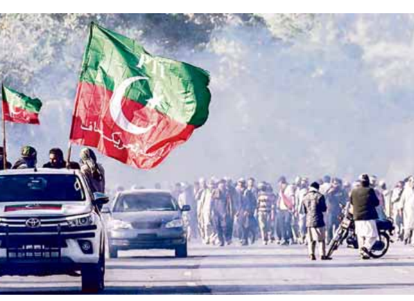
ట్రాన్స్మిట్టర్ తెలిపాయి. దీంతో నిరసనకారులు మొత్తంగా చెల్లా చెదురైపోయారని పేర్కొన్నారు. బుధవారం ఉదయం సగర కార్మికులు ఆ ప్రాంతంలోని శిధిలాలను తొలగించి, షిప్టింగ్ కంటెయినర్లను కొన్నింటిని తొలగించారు. భారీ బందోబస్తు చర్యలతో నిండిన ఆ ప్రాంతంలో ఆందోళనకారులు వాహనాలు చాలావరకు అక్కడే వుండిపోయాయి. పార్టీ నిరసనలను విరమించిన షెషావర్ సగర అధ్యక్షుడు తెలిపారు. సరైన రీతిలో సంప్రదింపులు జరిపిన తర్వాత కొత్త వ్యూహం రూపొందిస్తామని చెప్పారు.

ఇస్లామాబాద్: మాజీ ప్రధాని ఇమ్రాన్ ఖాన్ ను తక్షణమే విడుదల చేయాలని డిమాండ్ చేస్తూ వీధి నిరసనలు నిర్వహించిన పాకిస్తాన్ తెలీక్ ఇ అన్వార్స్ (పీటీఐ) మద్దతుదారులు తమ ఆందోళనలను విరమించారని స్థానిక మీడియా బుధవారం తెలిపింది. మంగళవారం రాత్రి రాజధాని ఇస్లామాబాద్లో భద్రతా బలగా దాడి చేసి, వందలాదిమందిని అరెస్టు చేసిన నేపథ్యంలో ఈ నిర్ణయం వెలువడింది. తాత్కాలికంగా నిరసనలను విరమించినట్లు పార్టీ ఒక ప్రకటనలో తెలిపింది. ఇమ్రాన్ న్యూస్ ట్రాన్స్మిట్టర్ తెలిపింది. సెంట్రల్ ఇస్లామాబాద్లో ఒక ప్రాంతంలో లైట్లన్నింటినీ తీసివేసి, పెద్ద మొత్తంలో బాష్పవాయు గోళాలను ప్రయోగించారని జియో న్యూస్, ఎఆర్ఎ