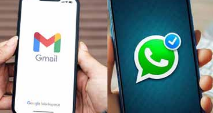
సమాచార ప్రసార విషయంలో థర్డ్-పార్టీ టూల్స్ అయిన వాట్సాప్, జీమెయిల్, ఇలాంటి ఇతర ప్లాట్ఫామ్లను ఉపయోగిస్తున్న ట్రిండ్ అధికారుల్లో పెరిగిపోతున్నదన్న విషయం యంత్రాంగం దృష్టికి వచ్చిందని జనరల్ ఆఫీసింగ్ డిపార్ట్ మెంట్ కమిషనర్ సెక్రటరీ సంచీవర్ వర్మ అన్నారు. థర్డ్-పార్టీ టూల్స్ ను ఉపయోగించటం ద్వారా అది అసాధికారిక

జమ్మూకాశ్మీర్ : అధికారిక డాక్యుమెంట్లను పంపించే విషయంలో థర్డ్-పార్టీ ప్లాట్ఫామ్లైన వాట్సాప్, జీమెయిల్లను ఉపయోగించటాన్ని జమ్మూకాశ్మీర్ ప్రభుత్వం నిషేధం విధించింది. సమగ్రత, భద్రతను కారణాలుగా పేర్కొన్నది. థర్డ్-పార్టీ ప్లాట్ఫామ్లను ఉపయోగం ద్వారా ఉండే ముప్పును ఎత్తి చూపింది. ఈ మేరకు సున్నితమైన, అధికారిక సమాచార మార్పిడి విషయంలో ప్రభుత్వం నమగ్ర మార్గదర్శకాలను విడుదల చేసింది. దీని ప్రకారం.. గోప్యత, పరిమిత సమాచార మార్పిడి, ప్రసారం కోసం ప్రభుత్వాధికారులు ఇక ప్రభుత్వ ఈమెయిల్ సర్వీసులను, దాని తక్షణ సురక్షిత సందేశ ప్లాట్ఫామ్లను కచ్చితంగా ఉపయోగించాల్సి ఆదేశాలు జారీ అయ్యాయి. సున్నిత, రహస్య, గోప్యమైన