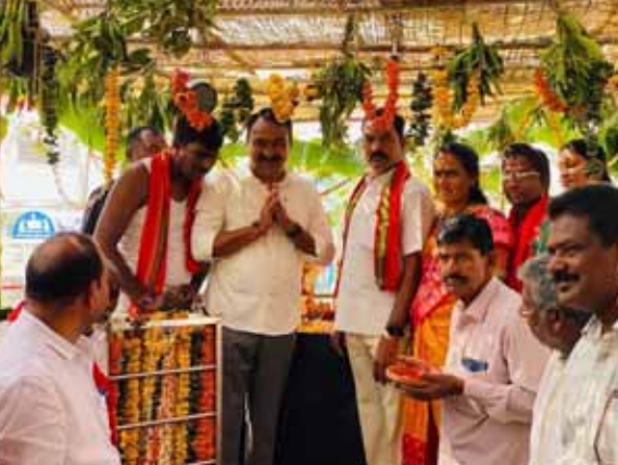
దని అన్నారు. గ్రామదేవత అందరిని చల్లగా చూసి తల్లి అని రాష్ట్ర, దేశం లోని ప్రజలంతా సుఖిష్టంగా ఉండాలని వేడుకున్నారు. ఈ కార్యక్రమంలో బొడ్డాయి కమిటీతో పాటు బిజెపి తూర్పు నియోజకవర్గం