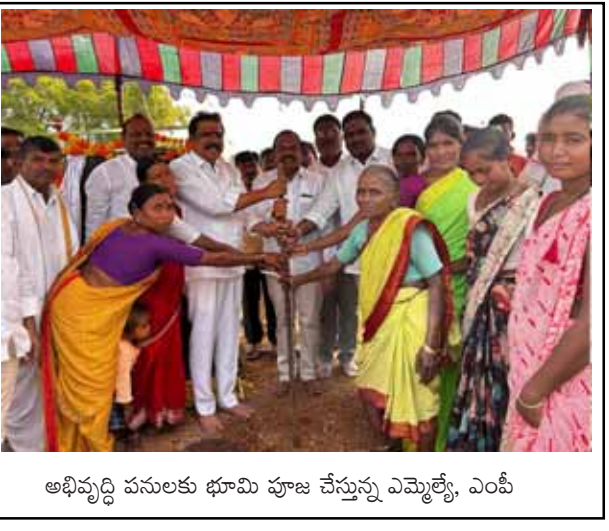
అభివృద్ధి పనులకు భూమి పూజ చేస్తున్న ఎమ్మెల్యే, ఎంపీ