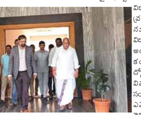
తీశారు. అనంతరం వైస్ ఛాన్సలర్ గోవర్ధన్ తో సమావేశమయ్యారు.

బాసర నవంబర్ 22 ( పుదయం ప్రతినిధి) బాసర త్రిబుల్ ఐటీ ని ఎమ్మెల్యే పవార్ రామారావు పటేల్ గారు శుక్రవారం ఆకస్మిక తనిఖీ చేపట్టారు. ఇటీవలే త్రిబుల్ ఐటీ లో స్వాతి అనే విద్యార్థి ఆత్మహత్య చేసుకోవడం, పెద్ద మొత్తంలో విద్యార్థి సంఘాల నాయకులు ఆందోళన చేపట్టిన విషయం తెలిసిందే. అందులో భాగంగానే ఆయన బాసర త్రిబుల్ ఐటీ కి వెళ్లి విద్యార్థులను కలిసి