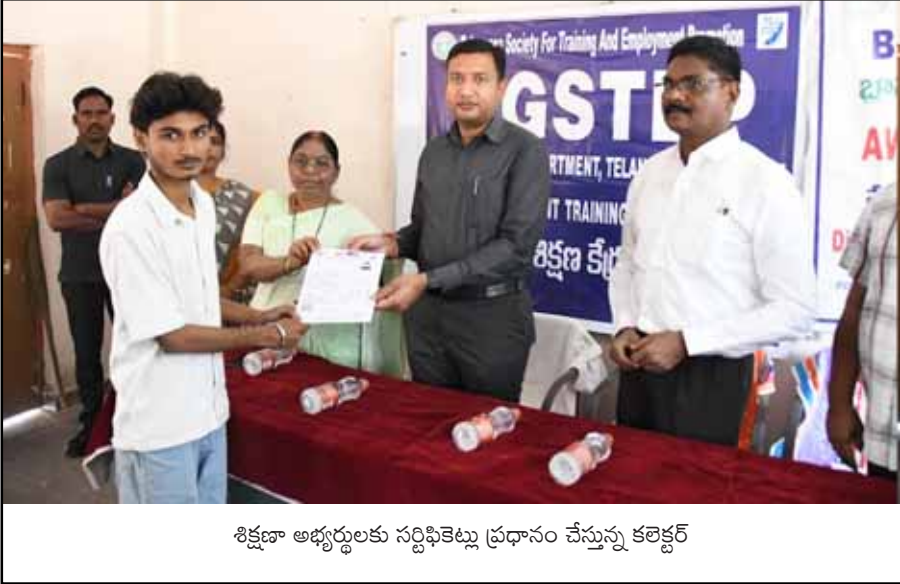
శిక్షణా అభ్యర్థులకు సర్టిఫికేట్లు ప్రధానం చేస్తున్న కలెక్టర్