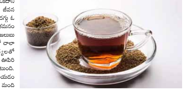
ఇది చాలా బాధాకరంగా ఉంటుంది. స్వాస్ ఆడకపోవడం వల్ల ముక్కు కారడం కొనసాగుతుంది. అపై డాక్టర్ వద్దకు పరుగెత్తాలి వస్తుంది. కానీ డబ్బు ఖర్చు

కొంత మందికి సీజన్ మారినప్పుడల్లా ఆరోగ్య సమస్యలు ఒకదాని తర్వాత ఒకటి దాడి చేస్తాయి. దీనివల్ల రోజువారీ జీవన విధానం కష్టంగా మారుతుంది. ముఖ్యంగా జలుబు, దగ్గు ఓ పట్టాన వదలవు. ఇలాంటి వారికి ఇంట్లోనే చక్కని ఉపశమనం పొందొచ్చు. సీజన్ మారుతున్న సమయంలో హఠాత్తుగా జలుబు చేయడం సర్వసాధారణం. ముఖ్యంగా ఈ సమయంలో చాలా మంది జలుబు కారణంగా ఛాతీ సమస్యలతో బాధపడుతుంటారు. ఛాతీ ఒకసారి చల్లగా మారి, ఊపిరి సలపకుండా అవుతుంది. ఇది చాలా బాధాకరంగా ఉంటుంది. సీజన్ మారుతున్న సమయంలో హఠాత్తుగా జలుబు చేయడం సర్వసాధారణం. ముఖ్యంగా ఈ సమయంలో చాలా మంది జలుబు కారణంగా ఛాతీ సమస్యలతో బాధపడుతుంటారు. ఛాతీ ఒకసారి చల్లగా మారి, ఊపిరి సలపకుండా అవుతుంది.