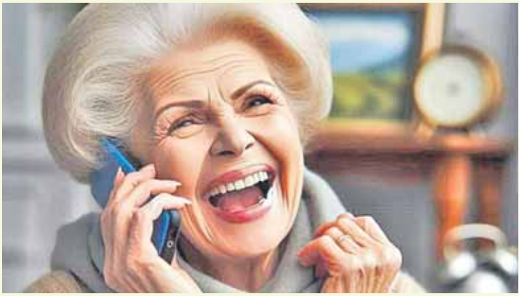
చేశారు. ఇది అప్పుడు మనిషిలానే మాటలు కలుపుతుంది. అవతలివారు చెప్పింది

న్యూఢిల్లీ: ఇటీవలి కాలంలో ఆన్లైన్ మోసాలు పెరిగిపోతున్నాయి. ఈ సమస్య ప్రపంచవ్యాప్తంగా ఉంది. వినయోగదారులకు కాలే చేసే బుర్రీ కాట్టింది కోట్ల రూపాయలు దండుకుంటున్న స్కామర్లకు చెక్ పెట్టేందుకు యూకే బెలికం కంపెనీ 'ఓ.2' ఏబి బామ్మ 'డై.సీ'ని సృష్టించింది. వినయోగదారులకు స్కామర్ల బుర్రీ కాట్టించడం కాదు.. ఏబి బామ్మ వారిని బుట్టలోకి దింపుతుంది. కుటుంబ విషయాలు, అవినీతి మాట్లాడుతూ వారి సమయాన్ని వృథా చేస్తుంది. తద్వారా ప్రజలు స్కామ్ కాల్స్ బారినపడకుండా కాపాడుతుంది. డై.సీ సాధారణ చాట్ బాట్ కాదు. అత్యంత అధునాతన ఏబి సాంకేతికతతో దీనిని డిజైన్ చేశారు. ఇది అప్పుడు మనిషిలానే మాటలు కలుపుతుంది. అవతలివారు చెప్పింది