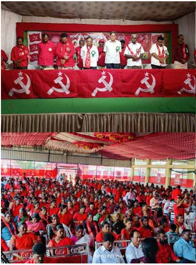
అగ్రహారంలో రోడ్డు మీదకు వచ్చిన ప్రజలకు ఎర్రజెండా ఇస్తామన్నారు. ఆరు గ్యారంటీలు ఎక్కడికి పోయాయని ప్రశ్నించారు. ప్రభుత్వం వచ్చే