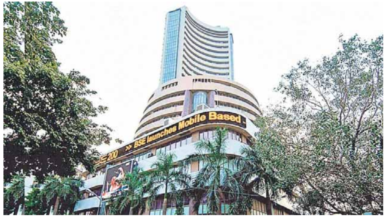
సుంచి చూస్తూ ప్రస్తుతం సెన్సెక్స్ 8,397.94 పాయింట్లు లేదా 9.76 శాతం కోల్పోయింది. నిఫ్టీ సైతం 2,744.65 పాయింట్లు లేదా 10.44 శాతం పడిపోయింది.

భారతీయ మార్కెట్ సుంచి తమ పెట్టుబడులను వెనక్కి తీసుకుపోతుండటం కూడా ఉన్నది. గత నెలలోనే రూ.94,000 కోట్లు తరలిపోయాయి. అలాగే ఈ ఆర్థిక సంవత్సరం (2024-25) రెండో త్రైమాసికానికి (జూలై-సెప్టెంబర్)గాను ఆయా సంస్థలు ప్రకటిస్తున్న నిరాశాజనక ఆర్థిక ఫలితాలూ కారణమే. అంతేగాక మదుపరుల లాభాల స్వీకరణ, అమెరికా బాండ్ ఈట్స్ పెరగడం, డాలర్ ఇండెక్స్ పరుగులు పెడుతుండటం కూడా ఉన్నాయి. సెప్టెంబర్ 27న సెన్సెక్స్ ఆల్ట్రామ్ హై 85,978.25 పాయింట్లను చేరింది. తొలిసారి నిఫ్టీ కూడా 26,277.35 పాయింట్లను తాకింది. అయితే అక్టోబర్ సుంచి మార్కెట్లో బేరిష్ ట్రెండ్ మొదలైంది. ఈ క్రమంలోనే ఆల్ట్రామ్ హై స్థాయి