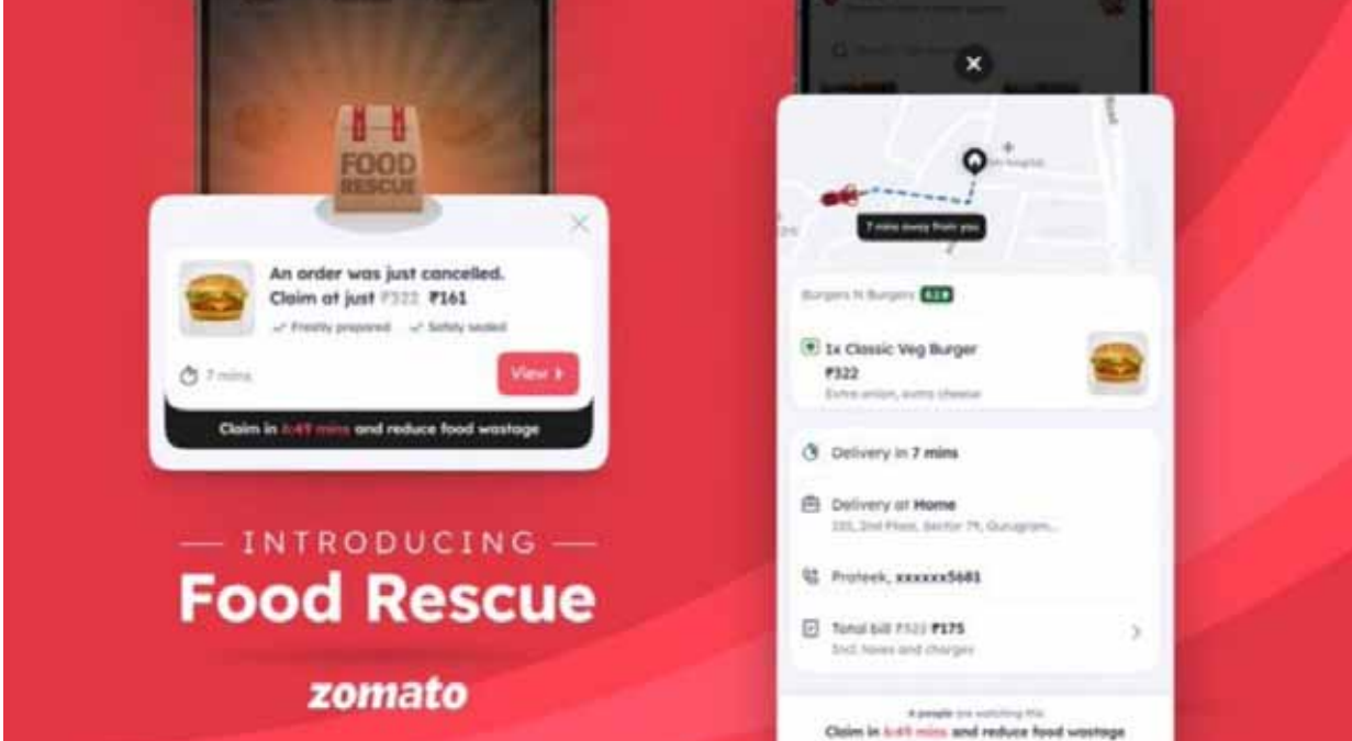
ఫుడ్ డెలివరీ యాప్ జోమాట్ ప్రత్యేక ఫీచర్ని తీసుకొచ్చింది. జోమాట్ ఈ కొత్త ఫీచర్కి 'ఫుడ్ రెస్క్యూ' అని పేరు పెట్టింది. ఈ ఫీచర్ ద్వారా

ప్రత్యేక కార్యక్రమాన్ని ప్రారంభించింది. ఈ ఫీచర్ని ఉపయోగించడం ద్వారా మీరు చాలా తక్కువ ధరలకు ఆహారాన్ని ఆర్డర్ చేసుకోవచ్చు. జోమాట్ సహ వ్యవస్థాపకుడు దీపిందర్ గోయల్ రద్దు చేసిన ఆర్డర్లను జోమాట్ ఏమాత్రం ప్రోత్సహించడం సోషల్ మీడియా ఫ్లాట్ఫారమ్ %లో రాసుకొచ్చారు. ఆర్డర్ క్యాన్సల్ చేయడం ద్వారా ఆహారం వృధా అవుతోంది. జోమాట్పై కఠినమైన విధానం, ఆర్డర్ రద్దు విషయంలో నో-రీఫండ్ పాలిసీ ఉన్నప్పటికీ కస్టమర్లు 4 లక్షల ఆర్డర్లను రద్దు చేశారని ఆయన చెప్పారు. ఇది మాకు ఆందోళన కలిగించే అంశమని, ఆహారాన్ని వృధా చేయడాన్ని ఎట్టిపరిస్థితుల్లోనూ అరికట్టాలన్నారు. అందుకే ఫుడ్ రెస్క్యూ ఫీచర్ని ప్రారంభిస్తున్నట్లు తెలిపారు. ఇకపోతే, రెస్టారెంట్ల భాగస్వామి ప్రారంభ ఆర్డర్ కోసం చెల్లించబడుతుంది. ఆర్డర్ రద్దు చేయబడి, కొత్త కస్టమర్ దానిని క్లెయిమ్ చేస్తే.. అతను అమౌంట్లో కొంత భాగాన్ని డిస్కౌంట్ పొందుతాడు. ఫుడ్ రెస్క్యూ ఫీచర్లో పాల్గొనకూడదనుకునే భాగస్వాములు తమ భాగస్వామి యాప్, డ్యాష్బోర్డ్ని ఉపయోగించి సులభంగా నిలిపివేయవచ్చు. కొత్త కస్టమర్లకు ప్రారంభ షిప్, చివరి డెలివరీతో సహా మొత్తం సేవ కోసం డెలివరీ భాగస్వామికి చెల్లించబడుతుంది. ఇటీవల, జోమాట్ అనేక కొత్త ఫీచర్లను చురుకుగా పరిచయం చేసింది. వీటిలో 'ట్రాండ్ ప్యాక్లు' ఉన్నాయి. ఇవి వారు తరచుగా ఆర్డర్ చేసే రెస్టారెంట్ల నుండి ఆహారంపై అదనపు తగ్గింపులను అందిస్తాయి.