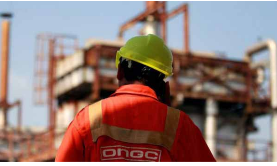
నవంబర్ 20గా ప్రకటించింది. సోమవారం ఎన్ఎస్ఇలో ఒఎన్జిసి షేర్ విలువ 2.02 శాతం తగ్గి రూ. 257.25 వద్ద ముగిసింది. ప్రభుత్వ రంగంలోని బ్యాంక్ ఆఫ్ ఇండియా (బి.ఐ.) 2024 సెప్టెంబర్తో ముగిసిన ద్వితీయ త్రైమాసికం (క్వార్టర్)లో 63 శాతం వృద్ధితో రూ. 2,374 కోట్ల నికర లాభాలు సాధించింది.

దేశంలోనే అతిపెద్ద చమురు ఉత్పత్తి కంపెనీ, ప్రభుత్వ రంగంలోని ఒఎన్జిసి ఆకర్షణీయ ఆర్థిక ఫలితాలు ప్రకటించింది. ప్రస్తుత ఆర్థిక సంవత్సరం సెప్టెంబర్తో ముగిసిన ద్వితీయ త్రైమాసికం (క్వార్టర్)లో 17 శాతం వృద్ధితో రూ. 11,984 కోట్ల నికర లాభాలు సాధించింది. గతేడాది ఇదే త్రైమాసికంలో రూ. 10,238 కోట్ల లాభాలు నమోదు చేసింది. అదే సమయంలో రూ. 35,163 కోట్లుగా ఉన్న రెవెన్యూ.. గడిచిన క్వార్టర్లో 4 శాతం తగ్గి రూ. 33,881 కోట్లుగా ప్రకటించింది. సోమవారం జరిగిన కంపెనీ బోర్డు సమావేశంలో ఇన్వెస్టర్లకు డివిడెండ్ను అందించాలని నిర్ణయించారు. ఆర్థిక సంవత్సరం 2024-25గాను మధ్యంతర డివిడెండ్ కింద ప్రతి రూ. 5 ముఖ విలువ కలిగిన షేర్పై రూ. 6 చెల్లించడానికి ఆ కంపెనీ బోర్డు ఆమోదం తెలిపింది. దీని రికార్డ్ తేదీని