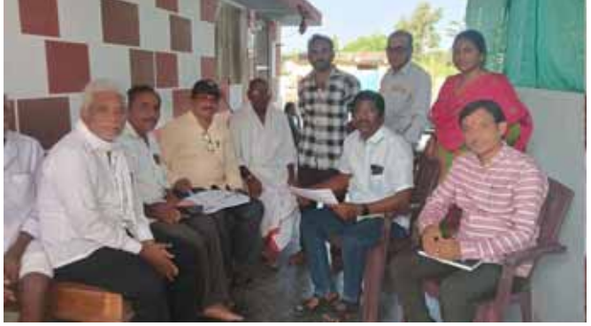
బెల్లంపల్లి, నవంబరు 12 (పుడయం ప్రతినిధి)రాష్ట్ర ప్రభుత్వం చేపడుతున్న సమగ్ర కుటుంబ, ఇంటి ఇంటి కులగణన సర్వేను తాండూర్ మండలం చౌటపల్లి

అధికారుల చొరవతో ప్రారంభమైన సమగ్ర కుటుంబ సర్వే