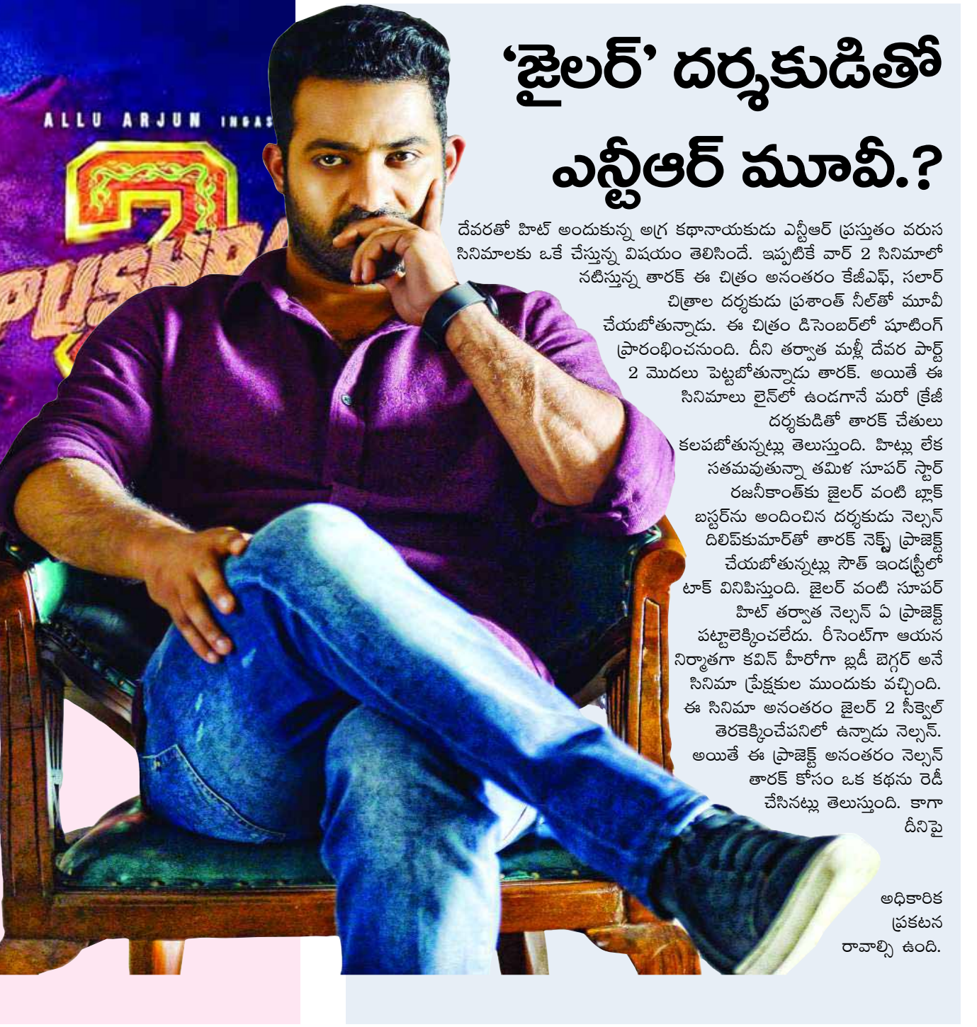
అధికారిక ప్రకటన రావాల్సి ఉంది.

అల్లు అర్జున్ అభిమానులకు గుడ్ న్యూస్. బాలీవుడ్ లో పుష్ప 2 సోలోగా రిలీజ్ కాబోతున్నట్లు తెలుస్తుంది. బాలీవుడ్ నటుడు విక్రీ కౌశల్ అల్లు అర్జున్ కు పోటీగా వస్తున్న విషయం తెలిసింది. ఐకాన్ స్టార్ అల్లు అర్జున్ నటిస్తున్న తాజా చిత్రం పుష్ప 2. భాక్ ఐస్టర్ మూవీ పుష్పకు సీక్వెల్ గా రాబోతున్న ఈ చిత్రంపై భారీ అంచనాలు ఉన్నాయి. సుకుమార్ దర్శకత్వంలో వస్తున్న ఈ చిత్రం డిసెంబర్ 05న ప్రేక్షకుల ముందుకు రానుంది. అయితే ఇదే రోజున బాలీవుడ్ నుంచి మరో ప్రెస్టీజియస్ మూవీ రాబోతున్న విషయం తెలిసింది. బాలీవుడ్ నటుడు విక్రీ కౌశల్ ప్రధాన పాత్రల్లో నటిస్తున్న తాజా చిత్రం ఛావా ఈ సినిమాను డిసెంబర్ 06న విడుదల చేయబోతున్నట్లు మేకర్స్ ప్రకటించారు. దీంతో ఈ రెండు సినిమాలు బాక్సాఫీస్ వద్ద తలపడబోతున్నట్లు తెలుస్తుంది. అయితే తాజా సమాచారం ప్రకారం పుష్ప 2 సినిమాకు ఉన్న క్రేజీ ఛావా తగ్గినట్లు తెలుస్తుంది. పుష్ప, ఛావా రెండు ఒకేసారి విడుదల అయితే సింగిల్ స్క్రీన్ డిస్ట్రిబ్యూటర్లు అంతా పుష్ప సినిమాకే మొగ్గు చూపినట్లు తెలుస్తుంది. దీంతో ఛావా సినిమాకి ఎదురుదెబ్బ తగితే అవకాశం ఉంది. మరోవైపు కరోనా లాక్ డౌన్ అనంతరం ఉత్తరాధిపత్య సింగిల్ స్క్రీన్ థియేటర్లు అన్ని పుష్ప సినిమాతోనే తెరచుకున్నాయి. దీంతో సింగిల్ స్క్రీన్ డిస్ట్రిబ్యూటర్లు అందరూ పుష్ప సినిమాకే ఓటు వేసినట్లు తెలుస్తుంది. ఇక ఛావా మేకర్స్ కూడా పుష్ప 2 కు ఉన్న పాపులారిటీని దృష్టిలో ఉంచుకుని విడుదలను వాయిదా వేయనున్నట్లు సమాచారం.