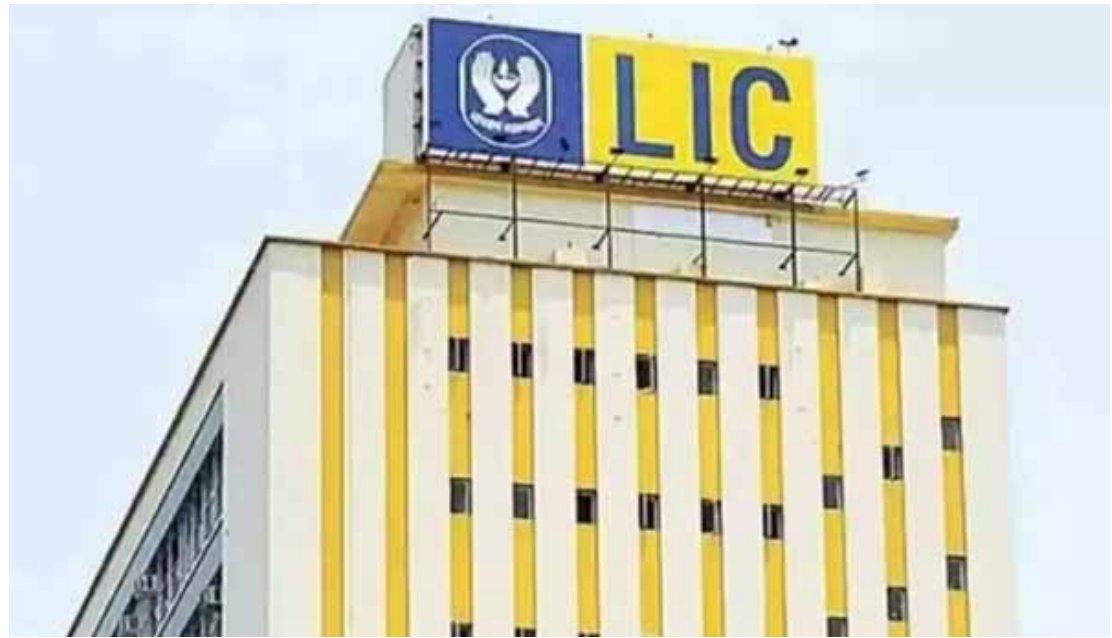
91.70 లక్షల వ్యక్తిగత పాలీసీలను విక్రయించింది. 2024 సెప్టెంబర్ ముగింపు నాటికి ఎల్ఐసీ అందర మేనేజ్మెంట్ (ఎయిఎం) ఆస్తులు 17 శాతం వృద్ధితో రూ.55.39 లక్షల కోట్లకు చేరింది.

దిగ్గజ జీవిత బీమా సంస్థ లైఫ్ ఇన్సూరెన్స్ కార్పొరేషన్ (ఎల్ఐసీ) 2024-25 సెప్టెంబర్తో ముగిసిన ద్వితీయ త్రైమాసికం (క్వార్టర్)లో రూ.7,621 కోట్ల నికర లాభాలు ప్రకటించింది. గతేడాది ఇదే త్రైమాసికంలో రూ.7,925 కోట్ల లాభాలు నమోదు చేసింది. దీంతో పోల్చితే గడిచిన క్వార్టర్ లాభాల్లో 4 శాతం తగ్గుదల చోటు చేసుకుంది. ఇదే సమయంలో నికర ప్రీమియం ఆదాయం మాత్రం 11 శాతం పెరిగి రూ.1.19 లక్షల కోట్లకు ఎగిసింది. గతేడాది ఇదే త్రైమాసికంలో రూ.1.07 లక్షల కోట్ల ప్రీమియం ఆదాయం చోటు చేసుకుంది. గడిచిన క్వార్టర్ పెట్టుబడులపై ఆదాయం 16 శాతం పెరిగి రూ.1.08 లక్షల కోట్లకు ఉంది. ఇది గతేడాది క్వార్టర్ రూ.93,942 కోట్లకు సమాదం. క్రితం సెప్టెంబర్ త్రైమాసికంలో సంస్థ తొలి ఏడాది ప్రీమియం ఆదాయం 12 శాతం పెరిగి రూ.11,201 కోట్లకు చేరుగా. గతేడాది ఇదే కాలంలో రూ.9,988 కోట్లకు ఉంది. ప్రస్తుత ఆర్థిక సంవత్సరం ప్రథమాంశంలో మొత్తంగా