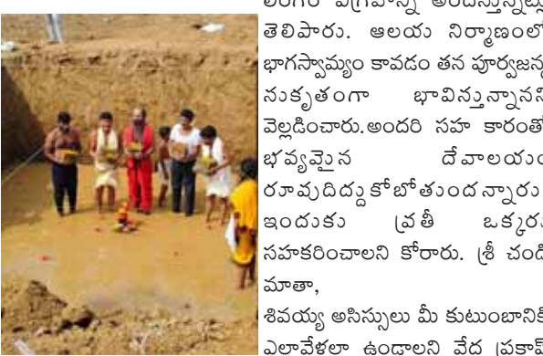
శివ కుటుంబ సభ్యులను వేద పండితులు ఆశీర్వదించారు.

బెల్లంపల్లి, నవంబర్ 09 (పుడయం ప్రతినిధి) మహబూబాబాద్ జిల్లా స్టేషన్ గుండ్రాతిమడుగులో కాశీ విశ్వనాథ దేవాలయం మరియు కత్తి వీధిలో ఆలయ నిర్మాణం కొరకు బెల్లంపల్లి కి చెందిన కాంగ్రెస్ పార్టీ నాయకులు భూమి పూజ చేశారు. అనంతరం ఆయన మాట్లాడుతూ. గ్రామ ప్రజలు నిర్మాణం కోరకు మేరకు ఆలయ భక్తుల కొరకు న్యవ్నందంగా ముందుకు వచ్చి ఆలయ ప్రతిష్ఠాపనుకు శివ