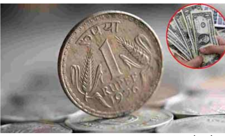
84.32 వద్ద ప్రారంభమైంది. అయితే ఆ తర్వాత 5 పైసల పదిహేయి అల్ టైమ్ కనిష్ట స్థాయికి పడిపోయింది. కాగా గత ట్రేడింగ్ సెషన్ గురువారం అమెరికా డాలర్తో పోల్చితే రూపాయి 1 పైసా మేర తగ్గిపోయింది. వడ్డీరేట్లను తగ్గిస్తూ ఇటీవల అమెరికా ఫెడరల్ రిజర్వ్ తీసుకున్న నిర్ణయంతో గ్లోబల్ పైనాన్షియల్ మార్కెట్లో పరిస్థితులు మారాయని ఫార్మ్ ఎక్స్చేంజీ పరిస్థితులు మారాయని ఫార్మ్ ఎక్స్చేంజీ తెలుపుతున్నారు. మరోవైపు డొనాల్డ్ ట్రంప్ డెబ్టును గెలవడంతో పన్నులు, ఉపాధిలో సమతుల్య సృష్టలను గుర్తించి యుఎస్ ఫెడ్ తటస్థ నుంచి వడ్డీ రేటును తగ్గించింది, ఆర్థిక నిర్ణయం ఎలా ఉంటుందో చూడాలన్నారు.

అమెరికా డాలర్ మారకంలో దేశీయ కరెన్సీ రూపాయి విలువ జీవితకాల కనిష్ట స్థాయికి దిగజారింది. దేశీయ మార్కెట్లోకి విదేశీ సంస్థాగత పెట్టుబడుల ప్రవాహం తగ్గిపోవడం, మరోవైపు మార్కెట్లపై ప్రభావం ఉండడం రూపీ విలువపై ప్రతికూల ప్రభావం చూపుతోంది. ఇవాళ ప్రారంభ ట్రేడింగ్లో అమెరికా డాలర్తో పోల్చితే రూపాయి మారకం విలువ 5 పైసల వరకు తగ్గిపోయింది. దీంతో జీవితకాల కనిష్ట స్థాయి 84.37కి పతనమైంది. ఫార్మ్ ఎక్స్చేంజీ వద్ద రూపాయి ఈ రోజు లాభంతో