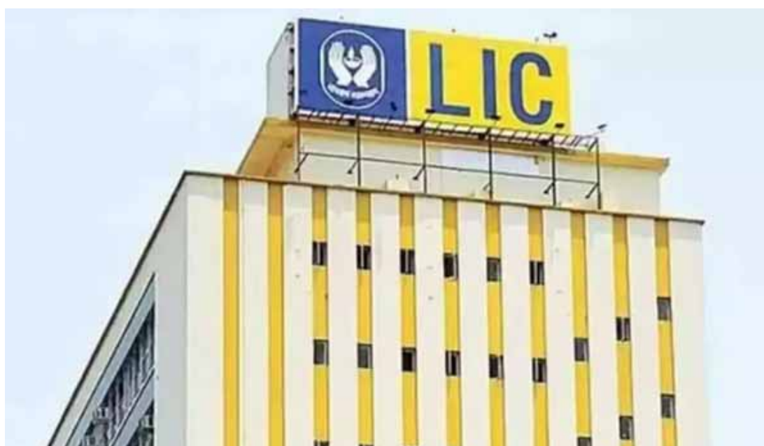
91.70 లక్షల వ్యక్తిగత పాలసీలను విక్రయించింది. 2024 సెప్టెంబర్ ముగింపు నాటికి ఎల్ఐసీ అసెట్స్ అండర్ మేనేజ్మెంట్ (ఎయిఎం) ఆస్తులు 17 శాతం వృద్ధితో రూ.55.39 లక్షల కోట్లకు చేరింది.

దిగ్గజ జీవిత బీమా సంస్థ లైఫ్ ఇన్సూరెన్స్ కార్పొరేషన్ (ఎల్ఐసీ) 2024-25 సెప్టెంబర్తో ముగిసిన ద్వితీయ త్రైమాసికం (క్వార్టర్)లో రూ.7,621 కోట్ల నికర లాభాలు ప్రకటించింది. గతేడాది ఇదే త్రైమాసికంలో రూ.7,925 కోట్ల లాభాలు నమోదు చేసింది. దీంతో పోల్చితే గడిచిన క్వార్టర్ లాభాల్లో 4 శాతం తగ్గుదల చోటు చేసుకుంది. ఇదే సమయంలో నికర ప్రీమియం ఆదాయం మాత్రం 11 శాతం పెరిగి రూ.1.19 లక్షల కోట్లకు ఎగిసింది. గతేడాది ఇదే త్రైమాసికంలో రూ.1.07 లక్షల కోట్ల ప్రీమియం ఆదాయం చోటు చేసుకుంది. గడిచిన క్వార్టర్ పెట్టుబడులపై ఆదాయం 16 శాతం పెరిగి రూ.1.08 లక్షల కోట్లకు ఉంది. ఇది గతేడాది క్వార్టర్ రూ.93,942 కోట్లకు నమోదయ్యింది. క్రితం సెప్టెంబర్ త్రైమాసికంలో సంస్థ తొలి ఏడాది ప్రీమియం ఆదాయం 12 శాతం పెరిగి రూ.11,201 కోట్లకు చేరగా.. గతేడాది ఇదే కాలంలో రూ.9,988 కోట్లకు ఉంది. ప్రస్తుత ఆర్థిక సంవత్సరం ప్రథమాంశంలో మొత్తంగా