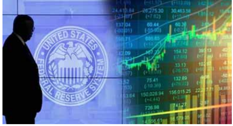
రేట్ల తగ్గింపు అమెరికా, ఇతర దేశాల వడ్డీ రేట్ల మధ్య వ్యత్యాసాన్ని పెంచవచ్చు. దీని కారణంగా.. కరెన్సీ క్యారీ ట్రేడ్ వరంగా భారతదేశం పంటి దేశాలు మరింత ఆకర్షణీయంగా మారవచ్చు.

అమెరికా ఫెడరల్ రిజర్వ్ గురువారం వడ్డీ రేట్లను 0.25 శాతం తగ్గించింది. 2024లో వడ్డీ రేట్లు తగ్గించడం ఇది రెండోసారి. ద్రవ్యోల్బణం ఇప్పుడు నియంత్రణలోకి వస్తుందని ఫెడ్ అభిప్రాయపడింది. డొనాల్డ్ ట్రంప్ అమెరికా అధ్యక్షుడిగా ఎన్నికై 48 గంటలు కూడా గడవని తరుణంలో ఈ నిర్ణయం తీసుకున్నారు. యుఎస్ సెంట్రల్ బ్యాంక్ ఎకనామిక్ డేటాపై నిఘా ఉంచుతుందని యుఎస్ ఫెడ్ చీఫ్ జెరోమ్ పావెల్ చెప్పారు. డిసెంబర్లో జరిగే తదుపరి సమావేశంలో, 2024లో వడ్డీ రేట్లలో తుది కోత పెట్టాలా వద్దా అని ఫెడ్ నిర్ణయిస్తుంది. అమెరికాలో వడ్డీ రేట్ల తగ్గింపు భారత్పై ఎలాంటి ప్రభావం చూపుతుందో తెలుసుకుందా.. వడ్డీ