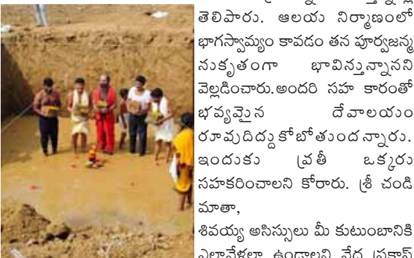
శివ కుటుంబ సభ్యులను వేద పండితులు ఆశీర్వదించారు.

బెల్లంపల్లి, నవంబర్09 (పుడయం ప్రతినిధి) మహబూబాబాద్ జిల్లా స్టేషన్ గుండ్రాతిమడుగులో కాశీ విశ్వనాథ దేవాలయం మరియు శక్తి వీధిలో ఆలయ నిర్మాణం కొరకు బెల్లంపల్లి కి చెందిన కాంగ్రెస్ పార్టీ నాయకులు భూమి పూజ చేశారు. అనంతరం ఆయన మాట్లాడుతూ. గ్రామ ప్రజలు భక్తుల కోరిక మేరకు ఆలయ నిర్మాణం కొరకు స్వచ్ఛందంగా ముందుకు వచ్చి ఆలయ ప్రతిష్ఠాపనకు శివ