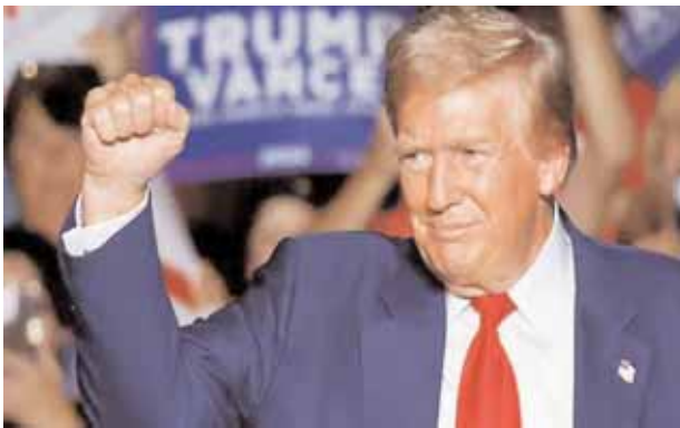
సాధించారు. పావులర్ ఓటులో ఓడి ఎలక్టోరల్ కాలేజీ ద్వారా గెలిచిన మొదటి రిపబ్లికన్ అధ్యక్షుడు ట్రంప్. నేరారోపణలు ఎదుర్కొంటూ అధ్యక్ష పదవిలో ఉన్న మొదటి వ్యక్తి ట్రంప్. ట్రంప్ మొదటిసారి అధ్యక్షుడిగా ఉన్నప్పుడు రెండుసార్లు అభిశంసన ఎదుర్కొన్నారు. ఒకే టర్మ్లో రెండుసార్లు అభిశంసన ఎదుర్కొన్న మొదటి వ్యక్తి ట్రంప్. ట్రంప్ కు కాంగ్రెస్ పార్టీ అభినందనలు.. సక్సెస్ కావాలని రాహుల్ ఆకాంక్ష..! అమెరికా అధ్యక్షుడిగా ఎన్నికైన డోనాల్డ్ ట్రంప్ ను కాంగ్రెస్

అమెరికా అధ్యక్ష ఎన్నికల్లో డోనాల్డ్ ట్రంప్ విజయం ఖాయమైంది. సీఎన్ఎన్ నివేదిక ప్రకారం రిపబ్లికన్ అభ్యర్థి ట్రంప్ 276 ఎలక్టోరల్ ఓట్లను గెలుచుకోగా, డెమోక్రటిక్ అభ్యర్థి కమలాహారిస్ 223 ఓట్లను మాత్రమే సాధించారు. విస్కాన్సిన్ లో గెలుపుతో ట్రంప్ మూడో ఫిగర్ (270) దాటారు. ఈ ఎన్నికల్లో విజయం ద్వారా రెండోసారి అధ్యక్ష బాధ్యతలు చేపట్టబోతున్న ట్రంప్.. పలు అరుదైన రికార్డులను తన పేరిట లిఖించుకున్నారు. ప్రముఖ వ్యాపారవేత్త, రియల్టీ స్టార్ నుంచి రాజకీయ స్టార్ గా ఎదిగిన ట్రంప్ గతంలోనే తొలిసారి అధ్యక్షుడు అయ్యారు. 2020లో జోబైడెన్ చేతిలో ఓడిపోయారు. అయితే ఈసారి కమలాహారిస్ పై విజయం సాధించి... అధ్యక్ష ఎన్నికల్లో గెలిచిన అత్యంత వృద్ధుడిగా నిలిచారు. ఆయన ఇప్పుడు 78 ఏళ్ల వయస్సులో రెండోసారి గెలుపొందారు. అధ్యక్షుడిగా ఉండి ఓడిపోయిన తర్వాత... ఆ తదుపరి ఎన్నికల్లో గెలిచిన రెండో వ్యక్తి ట్రంప్. ఇప్పటి వరకు గెలిచిన వారిలో అత్యంత వృద్ధుడు ట్రంప్. ప్రస్తుతం ట్రంప్ వయస్సు 78. జోబైడెన్ 77 ఏళ్లకు గెలిచి 81 ఏళ్ల వయస్సులో అధ్యక్ష పదవి నుంచి దిగిపోతున్నారు. 2016లో హిజ్రి క్లింటన్ కంటే పావులర్ ఓటింగ్లో వెనుకబడిన ట్రంప్.. ఎలక్టోరల్ కాలేజీలో విజయం