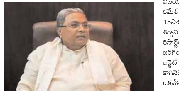
చేశారన్నారు. ప్రధాని నరేంద్రమోదీ అబద్ధాల కోరు అని, ఒకప్పుడు కుమారస్వామి వ్యాఖ్యానించారని, రెండోసారి మోదీ ప్రధాని అయితే దేశం వీడుతానని దేవగౌడ ప్రకటించారని, ప్రస్తుతం ఆయనతోనే వారంతా చెట్టబట్టలే వేసుకున్నారున్నారు. బీజేపీ అధ్యక్షుడు విజయేంద్ర చెక్ లో లంచం తీసుకున్నారని, నా గురించి మాట్లాడతారన్నారు.

బెంగళూరు: నలభై ఏళ్లకిందటే మంత్రిని అయ్యాను, సంపాదనే లక్ష్యమైతే ఎంతో సంపాదించేవాన్ని కానీ నిజాయితీ, నైతికతను సమ్యాను, అటువంటిది 14 ఇంటి స్థలాలకోసం తప్పు చేస్తా..? అంటూ సీఎం సిద్ధరామయ్య ప్రశ్నించారు. మంగళవారం శిగావి వియోజకవర్గ పరిధిలోని చందాపుర బహిరంగసభలో ఆయన మాట్లాడుతూ 40ఏళ్లుగా రాజకీయాల్లో కాదు మంత్రి పదవితోపాటు ఎన్నో కీలకమైన హోదాలలో కొనసాగాను. ఆరున్నరేళ్లుపాటు ముఖ్యమంత్రిగా ఉన్నా.. అటువంటిది 14 ఇంటిస్థలాలకోసం తప్పు చేస్తా..? ఎవరైనా సమ్ముతారా..? అంటూ ప్రశ్నించారు. తప్పు చేయకున్నా, తప్పుడు ఆరోపణలతో తనపై కుట్ర పన్నారన్నారు. ప్రజలు ఇటువంటివాటికి అవకాశం ఇవ్వనక్కర్లేదు. యుడియారపును రాజకీయంగా ముగించేందుకు బసవరాజ్ బొమ్మె షాన్ చేశారని, యుడియారపుతో కలిసి ఉంటూనే కోలుకోలేని రాజకీయం