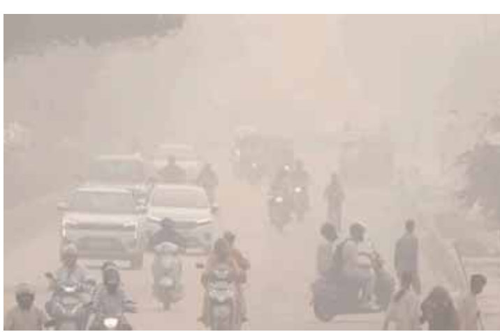
పరిచాలన్నారు. అత్యవసరమైతే తప్ప బయటకు రావద్దని సూచిస్తున్నారు. ఇంట్లోనే ఉండి యోగా, ప్రాణాయామం చేయాలని సూచిస్తున్నారు. ఢిల్లీలో వాయుకాలుష్యం పెరుగుతోందని ఢిల్లీ ప్రభుత్వ పర్యావరణ శాఖ మంత్రి గోపాల్ రాయ్ పేర్కొన్నారు. కాలుష్యాన్ని తగ్గించడంపై ప్రభుత్వం దృష్టి సారినోచిందన్నారు. కాలుష్య స్థాయిని తగ్గించేందుకు సంబంధిత ఏజెన్సీలన్నీ చురుగ్గా పని చేస్తున్నాయని.. కాలుష్యం పెరుగుతున్న నేపథ్యంలో శీతాకాల కార్యచరణ ప్రణాళిక కింద వివిధ

దేశ రాజధాని ఢిల్లీలో వాయు కాలుష్యం కొనసాగుతోంది. రోజురోజుకూ కాలుష్యం తీవ్రమవుతోంది. కాలుష్యం కారణంగా ఢిల్లీ వాసులు తీవ్ర ఇబ్బందులు పడుతున్నారు. ఓ వైపు వాయు కాలుష్యంతో ఊపిరితీసుకోవడం ఇబ్బందికరంగా మారగా.. మరో వైపు నీటి కాలుష్యంతోనూ సతమతమవు తున్నారు. యుయనా నదిలో కాలుష్య స్థాయి విపరీతంగా ఉన్నది. కేంద్ర కాలుష్య నియంత్రణ మండలి ప్రకారం.. దేశ రాజధాని నగరంలో బుధవారం ఉదయం 8 గంటల సమయంలో గాలి నాణ్యత సూచి 358గా నమోదైంది. అల్పవార్షిక ఏకవార్షిక 372గా, బావన ప్రాంతంలో 412, ద్వారకా సెక్టార్ 8లో 355, ముంద్యూలో 419, నజాఫ్ గడ్ ప్రాంతంలో 354, న్యూ మోతి భాగ్ లో 381, రోహిణీలో 401, పంజాబి భాగ్ లో 388, ఆర్ధ్వరంలో 373గా ఏకవార్షిక నమోదైంది. ఆయా ప్రాంతాల్లో గాలి నాణ్యత సూచి అధ్వాన స్థితిలో ఉన్నట్లు పోల్యూషన్ కంట్రోల్ బోర్డ్ పేర్కొంది. కాలుష్యం నేపథ్యంలో విజిబిలిటీ సైతం తగ్గింది. పలు ప్రాంతాల్లో దట్టమైన పొగమంచు కమ్మేసింది. వివేక్ విహార్, ఆనంద్ విహార్, ఇందియా గేట్ తదితర ప్రాంతాల్లో 500 మీటర్ల వరకు దృశ్యమానత తగ్గింది. పెరుగుతున్న కాలుష్యంతో ప్రజల కళ్లలో మంటలు, శ్వాస తీసుకోవడంలో ఇబ్బందులు పడుతున్నారని. ఈ క్రమంలో వైద్య నిపుణులు హెచ్చరికలు చేస్తున్నారు. గర్భిణులు, చిన్నపిల్లలు, వృద్ధులు, శ్వాసకోశ వ్యాధులతో బాధపడుతున్న వారు ప్రత్యేక శ్రద్ధ