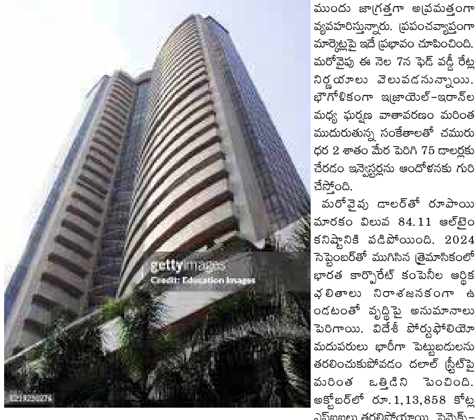
ఇది ఆగస్టు 6 నాటి కనిష్ట స్థాయి. కాగా.. ఇంట్రాడేలో ఏకంగా 1,491 పాయింట్లు కోల్పోయి.. 78,232.60 కనిష్ట స్థాయిని తాకింది. ఎన్ఎస్ఎస్ నిష్ఠీ 309 పాయింట్ల నష్టంతో 23,995 వద్ద ముగిసింది. అమెరికా అధ్యక్ష ఎన్నికలు నవంబర్ 5న 30లో కేవలం ఆరు స్టాక్స్ మాత్రమే రాణించాయి.

దేశీయ స్టాక్ మార్కెట్లు మరోసారి కుప్పకూలాయి. రెండు రోజుల్లో అమెరికా అధ్యక్ష ఎన్నికల ఫలితాలు వెలువడనున్న నేపథ్యంలో మదుపర్లు ముందస్తు అప్రమత్తం అమృతాలకు మొగ్గు చూపారు. దీంతో సోమవారం ఒక్క ఫూటర్లేనే బిఎస్ఎస్ సెన్సెక్స్ 942 పాయింట్లు పతనమై.. మూడు నెలల కనిష్టానికి పడిపోగా.. ఎన్ఎస్ఎస్ నిష్ఠీ 1 శాతం క్షీణించి 24,000 పాయింట్ల దిగువకు జారింది. రిలయన్స్ ఇండిస్ట్రీస్, బ్యాంకింగ్ షేర్లలో అమృతాలు వెల్లువ వోటు చేసుకుంది. ఉదయం స్వల్ప సవ్యలో ప్రారంభమైన సూచీలు.. క్రమంగా భారీ నష్టాల్లోకి జారుకున్నాయి. ఈ క్రమంలోనే బిఎస్ఎస్ సెన్సెక్స్ 941.88 పాయింట్లు లేదా 1.18 శాతం క్షీణించి 78,782కు దిగజారింది.