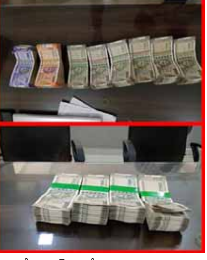
కటింసగర్, మే 06 (పుడయం ప్రతినది) బీపార్లమెంట్ ఎన్నికల సందర్భంగా,