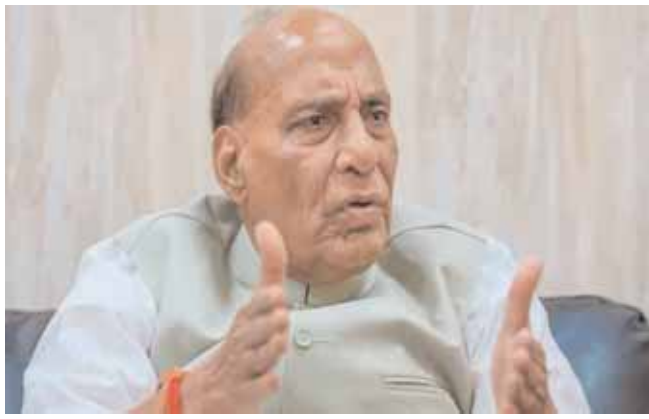
సైకోసిస్ భయాన్ని సృష్టించాలని చూస్తోందని సంపదల వ్యాఖ్యలు చేశారు. వాళ్లకు ఎలాంటి సమస్య లేదని.. కులం, మతం పేరుతో సమాజాన్ని విభజించి ప్రభుత్వాన్ని ఏర్పాటు చేయాలనుకుంటున్నారని చెప్పారు.

కేంద్ర రక్షణ మంత్రి రాజ్ నాథ్ సింగ్ తాజాగా కాంగ్రెస్ పార్టీపై తీవ్ర విమర్శలు గుప్పించారు. ఎన్నికల ప్రయోజనాల కోసమే హిందూ, ముస్లిం వర్గాల మధ్య చిచ్చు పెట్టేందుకు కాంగ్రెస్ ప్రయత్నిస్తోందని.. మతపరమైన ఉద్దేశాలను సృష్టించాలని చూస్తోందని ఆరోపించారు. రాహుల్ గాంధీలో ఫైర్ లేదు కానీ, కాంగ్రెస్ మాత్రం నిప్పుతో చెలాగుటం ఆడుతోందని దుయ్యబట్టారు. ఓ జాతీయ వార్తా సంస్థకు ఇచ్చిన ఇంటర్వ్యూలో ఆయన ఈ వ్యాఖ్యలు చేశారు. "హిందూ, ముస్లిం వర్గాల మధ్య చిచ్చు పెట్టి.. సామాజిక సామరస్యాలను భంగం కలిగించాలని కాంగ్రెస్ అనుకుంటోంది. ముస్లిం సమాజాన్ని ఆ పార్టీ కేవలం ఓటు బ్యాంకుగానే చూస్తోంది. వారికి నేను ఓ సలహా ఇవ్వాలని అనుకుంటున్నా.. కేవలం ప్రభుత్వాలను ఏర్పాటు చేయడం కోసం రాజకీయాలు చేయకూడదు. దేశాభివృద్ధి రాజకీయాల లక్ష్యం" అని రాజ్ నాథ్ సింగ్ పేర్కొన్నారు. కాంగ్రెస్ హిందూ-ముస్లిం కార్డస్ ఉపయోగించాలని అనుకుంటోందని, ఆ పార్టీ