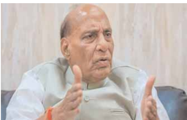
సైకోస్ భయాన్ని సృష్టించాలని చూస్తోందని సంచలన వ్యాఖ్యలు చేశారు. వాళ్లకు ఎలాంటి సమస్య లేదని.. కులం, మతం పేరుతో సమాజాన్ని విభజించి ప్రభుత్వాన్ని ఏర్పాటు చేయాలనుకుంటున్నారని చెప్పారు.

కేంద్ర రక్షణ మంత్రి రాజ్ నాథ్ సింగ్ తాజాగా కాంగ్రెస్ పార్టీపై తీవ్ర విమర్శలు గుప్పించారు. ఎన్నికల ప్రయోజనాల కోసమే హిందూ, ముస్లిం వర్గాల మధ్య చిచ్చు పెట్టేందుకు కాంగ్రెస్ ప్రయత్నిస్తోందని.. మతపరమైన ఉద్రిక్తతలు సృష్టించాలని చూస్తోందని ఆరోపించారు. రాహుల్ గాంధీలో పైర్ లేదు కానీ, కాంగ్రెస్ మాత్రం నిప్పుతో చెలాటం ఆడుతోందని దుయ్యబట్టారు. ఓ జాతీయ వార్తా సంస్థకు ఇచ్చిన ఇంటర్వ్యూలో ఆయన ఈ వ్యాఖ్యలు చేశారు. "హిందూ, ముస్లిం వర్గాల మధ్య చిచ్చు పెట్టి.. సామాజిక సామరస్యానికి భంగం కలిగించాలని కాంగ్రెస్ అనుకుంటోంది. ముస్లిం సమాజాన్ని ఆ పార్టీ కేవలం ఓటు బ్యాంకుగానే చూస్తోంది. వారికి నేను ఓ సలహా ఇవ్వాలని అనుకుంటున్నా.. కేవలం ప్రభుత్వాలను ఏర్పాటు చేయడం కోసం రాజకీయాలు చేయకూడదు. దేశాభివృద్ధి రాజకీయాల లక్ష్యం" అని రాజ్ నాథ్ సింగ్ పేర్కొన్నారు. కాంగ్రెస్ హిందూ-ముస్లిం కార్టవీ ఉపయోగించాలని అనుకుంటోందని, ఆ పార్టీ