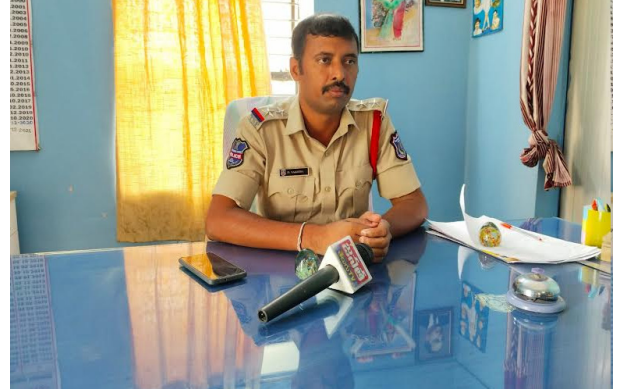
యాదాద్రి భువనగిరి / గుండాల మే 05 పుడయం ప్రతినది :

గుండాల మండల కేంద్రంలోని వివిధ గ్రామాలలో ప్రస్తుతం దొంగతనాలు ఎక్కువగా జరుగుతున్నాయని ప్రజలు అప్రమత్తంగా ఉండాలని ఎన్ఫో యాక్సన్ ప్రజలకు విజ్ఞప్తి చేశారు. మండలంలోని రెండు మూడు గ్రామాలలో దొంగతనాలు జరిగాయని ఈ సందర్భంగా ఎన్ఫో యాక్సన్ మాట్లాడుతూ ఒంటరిగా మహిళలు వృద్ధులు ఇంటికి తాళాలు వేసిన ఇండ్లను రాత్రి సమయంలో మేడపై పనుకునే ఇంటి బయట పనుకునే వారి ఇండ్లను దొంగలు టార్గెట్ చేసి దొంగతనాలు చేస్తున్నారని అన్నారు ఇంటికి తాళం వేసి ఊర్లు వెళ్లినప్పుడు పోలీసులకు సమాచారం ఇవ్వాలన్నారు మీ ఇండ్లలో మీ విలువైన వస్తువులను అవహరణకు గురికాకుండా తగు జాగ్రత్తలు తీసుకోవాలన్నారు. మీరు ఊర్లకు వెళ్లినప్పుడు ఎవైనా బయటికి వెళ్లినప్పుడు పోలీసు వారికి సమాచారం ఇచ్చి ఊరికి వెళ్లాలని ప్రజలకు విజ్ఞప్తి చేశారు.