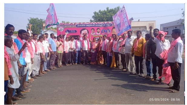
యాదాద్రి భువనగిరి / మే 5 పుడయం ప్రతినది : మోత్యూర్ మండలం అనాజిపురం గ్రామంలో ఇంటింటికి గడపగడపకు తిరిగి కెసిఆర్