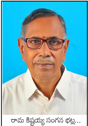
రామ కిష్టయ్య సంగం భట్ట...

తొలగించడం లేదా చంపడంవంటి అనేక ఇతర క్రూర చర్యలకు బాధ్యులైన వారిని చట్టం ద్వారా శిక్షిస్తారు. జంతు రవాణాలో అనవసర హింసకు పాల్పడే వారికి, జంతువులను కిక్కిరిసిపట్టుగా వాహనాల్లో నింపేవారికి, జంతువుల కాళ్ళు కట్టిన వాహనాలపై తీసుకువేళ్ళే వారికి రూ 100 లేదా మూడు నెలల కాలాగార శిక్ష లేదా రెండు శిక్షలు కలిపి విధించవచ్చు. భారత శిక్షా స్ఫుతి సెక్షన్లు 428 మరియు 429 కింద జంతువులను భయపెట్టడం గాదు పరచడం చట్టవిరుద్ధం. జంతువులను లేదా జంతు సంరక్షకులను భయం కంటితలను చేయడాన్ని 1860 భారత శిక్షాస్ఫుతి సెక్షన్ 503 ప్రకారం తెలిసి లేదా స్పృహతో చేస్తున్న నేరంగా పరిగణిస్తారు. ఇటువంటి వారిని ఎటువంటి వారంటు లేకుండా అదుపులోకి తీసుకోవచ్చు. జంతుసంపదను పరిరక్షించడం, వాటిని వృద్ధి చేయడంతోపాటు జంతువుల హక్కులను కాపాడటం ప్రతి ఒక్కరి బాధ్యత. మానవ మనుగడకు అనివార్యమైన పలు ప్రాయోజనాలైన జంతు సంపదను పరిరక్షించడం, వృద్ధిచేయడం, మానవీయ కోణంలో చూడడం, తగిన స్వేచ్ఛ కల్పించడం అందరి బాధ్యత. జంతువులపట్ల మరింత మానవీయంగా ప్రవర్తించడం, ఈ స్ఫూర్తిని భావితరాలకు తెలియ జేయడం అవసరం, అనివార్యం.