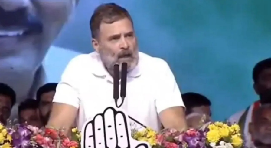
హైదరాబాద్, మే 05 (పుడయం ప్రతినీధి): కాంగ్రెస్ పార్టీ కేంద్రంలో అధికారంలో వస్తే 50 శాతం రిజర్వేషన్ల పరిమితి పెత్తివేసి, రిజర్వేషన్లు పెంచుతామని కాంగ్రెస్ అగ్రనేత రాహుల్ గాంధీ హామీ ఇచ్చారు. అదిలాబాద్ పార్లమెంటు అభ్యర్థి ఆత్రం సుగుణ ఎన్నికల ప్రచార సభలో రాహుల్ గాంధీ ప్రసంగించారు. బీజేపీ మరోసారి అధికారంలోకి వస్తే రాజ్యాంగాన్ని మార్చాలని చూస్తుందని, ఈ పార్లమెంటు ఎన్నికలో