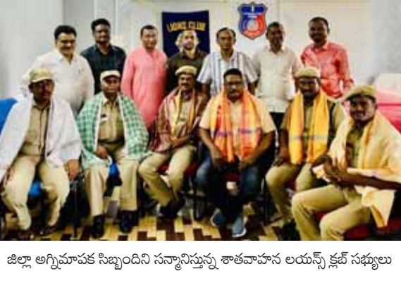
జిల్లా అగ్నిమాపక సిబ్బందిని సన్మానిస్తున్న శాతవాహన లయన్ క్లబ్ సభ్యులు