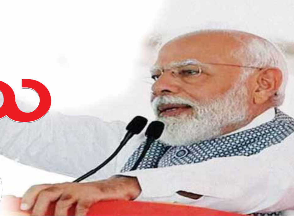
మోదీ కాంగ్రెస్ వినూదా దేశం కోసం పనిచేయడం.. ఓటు బ్యాంకు దేశం ప్రయత్నిస్తున్నదని ప్రధానమంత్రి సరేంద్రమోదీ అన్నారు. మంగళవారం మొదటి బీజేపీ భారీ బహిరంగ సభ నిర్వహించింది. ఈ సభలో ప్రధాని మోదీ పాల్గొన్నారు. ఈ సభలో కాంగ్రెస్, బీఆర్ఎస్ పార్టీలపై మోదీ తీవ్ర విమర్శలు గుప్పించారు. తెలంగాణ కుటుంబ సభ్యులందరికీ సమస్యలు అంటూ తెలుగులో మోడీ స్పీచ్ ప్రారంభించారు. బసమేశ్వర్, సంగమేశ్వర్, సీవాలాల్ మహారాజ్ కు నా సమస్యలు తెలిపారు. గత పదేళ్లలో ఎట్టివి ప్రభుత్వం దేశాన్ని ఎంత అభివృద్ధి చేసిందో మీరంతా చూశారని చెప్పారు. ఒకప్పుడు ప్రపంచం మొత్తం అభివృద్ధిలో దూసుకుపోతుంటే.. కాంగ్రెస్ కరప్షన్ తో అవినీతి ఊబిలోకి నెట్టేసి దేశాన్ని మొత్తం ముంచేసిందన్నారు. కానీ కేంద్రంలో బీజేపీ ప్రభుత్వం వచ్చాక అవినీతి ఊబి నుంచి

ఫేక్ వీడియోల వెనుక 'దబుల్ ఆర్'.. వాలని వదిలిపెట్టేటేమ