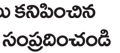
మాట్లాడుతూ జడ్జి చెప్పారు. మోటారు వాహనాల అలోగ్నం గురించి వివరిస్తూ ప్రి ఒక్కరు వదదెబ్బ లక్షణాలు కనిపిస్తే వెంటనే డాక్టర్లు సంప్రదించి చికిత్స తీసుకోవాలని తద్వారా మనం వదదెబ్బ నుండి రక్షణ పొందవచ్చు అని తెలియజేశారు. చట్టాలపట్ల అవగాహన ఉంటే తప్ప జరుకముందే మనం జాగ్రత్త పడవచ్చని, చట్టాలపై ప్రతి ఒక్కరు అవగాహన కలిగి ఉండాలని, చట్టం దృష్టిలో ఉన్నప్పుడు ప్రమాదం సమానమని, చట్టాన్ని ఉల్లంగిస్తే శిక్షలు తప్పవని, ఈరోజు కురవి మండల కేంద్రంలోని ప్రాథమిక అలోగ్నకేంద్రంలో ప్రపంచ అలోగ్న దినోత్సవాన్ని పురస్కరించుకుని జరిగిన న్యాయవిజ్ఞాన సదస్సులో మాట్లాడుతూ జడ్జి చెప్పారు. మోటారు వాహనాల అలోగ్నం గురించి వివరిస్తూ ప్రి ఒక్కరు వదదెబ్బ లక్షణాలు కనిపిస్తే వెంటనే డాక్టర్లు సంప్రదించి చికిత్స తీసుకోవాలని తద్వారా మనం వదదెబ్బ నుండి రక్షణ పొందవచ్చు అని తెలియజేశారు. చట్టాలపట్ల అవగాహన ఉంటే తప్ప జరుకముందే మనం జాగ్రత్త పడవచ్చని, చట్టాలపై ప్రతి ఒక్కరు అవగాహన కలిగి ఉండాలని, చట్టం దృష్టిలో ఉన్నప్పుడు ప్రమాదం సమానమని, చట్టాన్ని ఉల్లంగిస్తే శిక్షలు తప్పవని, ఈరోజు కురవి మండల కేంద్రంలోని ప్రాథమిక అలోగ్నకేంద్రంలో ప్రపంచ అలోగ్న దినోత్సవాన్ని పురస్కరించుకుని జరిగిన న్యాయవిజ్ఞాన సదస్సులో