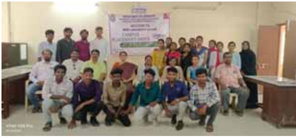
మరియు 10మంది ఎమ్మెస్సీ (ఆర్డీసీ) విద్యార్థులు ఉద్యోగాలకు అధికారికంగా ఎంపికయ్యారు. ఎంపికైన విద్యార్థులకు వివిధ విభాగాల్లో ఇంటర్నల్ షిప్ అందించనున్నట్లు సంస్థ ప్రతినిధి తెలిపారు. వారికి ఇంటర్నల్ షిప్ సమయంలో రూ. 2. ఓ ఎల్ పి ఏ జీతం , అది పూర్తయిన తర్వాత