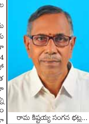
రామ చిట్టయ్య సంగం భట్ల..