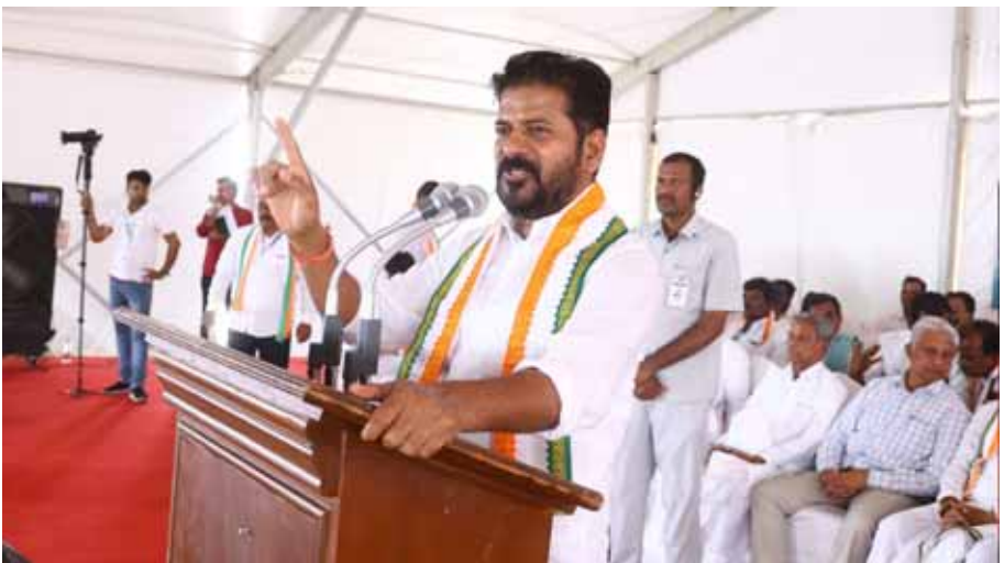
అధ్యక్షుడుగా దేశ రాజకీయాల్లో కీలక పాత్ర వహిస్తున్నారన్నారు. మీరు ఇచ్చిన స్పూర్తితో కర్ణాటకలో కాంగ్రెస్ ప్రభుత్వం ఏర్పడింది, ఐదు గ్యారంటీలను అమలు చేసినందుకు తెలంగాణలోనూ ఆరు

హైదరాబాద్, ఏప్రిల్ 29 : సరేలో మోదీ ప్రజలను నమ్మించి మోసం చేశారని, కరువు వస్తే కనీసం బొంగుళూరుకు నీళ్లు కూడా ఇవ్వలేదు, మోదీ కర్ణాటకు ఖాళీ చెంబు తప్ప ఏమీ లేదన్నారు సీఎం రేవంత్ రెడ్డి. కర్ణాటక నుంచి 26 ఎంపీలను ఇస్తే మోదీ కర్ణాటకకు ఇచ్చింది ఒకటే కేబినెట్ పదవని విమర్శించారు. గుర్తింపుల్లో ఎన్నికల ప్రచార సభలో ఆయన మాట్లాడారు. ఇక్కడి నుంచి తొమ్మిదిసార్లు ఎమ్మెల్యేగా, రెండు సార్లు ఎంపీగా మల్లికార్జున ఖర్జే కొనసాగారన్నారు. 1972లో మొదటిసారిగా మీరు ఎన్నుకున్న మల్లికార్జున ఖర్జే ఇప్పుడు ఎంపీని